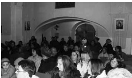
A templomban megteltek a padsorok

November 11-én rendeztük meg a helyi Óvodával együtt, az immár hagyományná vált Márton-napi ünnepséget . A református templomtól elsetáltunk a katolikus templomig. A gyerekek saját készítésű lámpásaikat vitték magukkal és énekszótól lettek hangosak Nagypall utcái, mi-