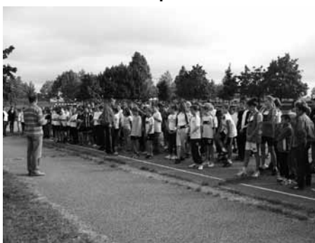
A népes mezőnyben a hidasiak a legjobbak közé tartoztak

Október 10-11-én a pécsi Árpád Fejedelem Gimnázium és a FEMA között rendezték meg a diákolimpiát. A csapatversenyre 4 fős csapatok jelentkezhettek. 18 iskola vett részt Pécsről és környékéről.