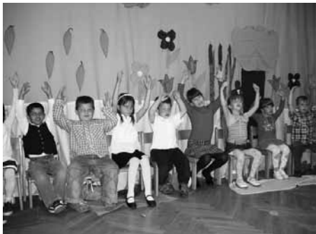
A három csoport megható műsorral készült az édesanyáknak, nagymamáknak

Az április a közlekedés jegyében telt. A gyerekek megtanulták, hogyan kelhetnek át biztonságosan az útesten, megismerkedtek különféle szárazföldi és légi járművekkel. Kreszpályák segítségével tájolódtak az elképzelt útvonalon.