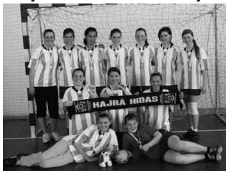
Idén nem találtak legyőzőre a lányok az amatőrök között.

Áprilisban véget ért Pécssett az amatőr városi kézilabdás 4.korcsoportos lányok számára. Ősszel mindhárom mérkőzését megnyerte a hídasi csapat, így első helyen telettünk. Mivel most tavasszal sem hibáztak a mieink, így veretlenül, sőt 100%-os teljesítménnyel lettünk bajnokok. Az aranyérmeket az MDSZ vezetői adták át a pécsi Csokonai iskola sportcsarnokában, miután a záró fordulóban is 40-14-es gólkülönbséggel múltuk felül városi ellenfeleinket. A végeredmény: 1. Hidas, 2. Csokonai Pécs, 3. Mátyás Pécs, 4. TVT Pécs.