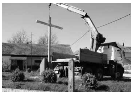
A templom mellé került a nagyméretű kereszt

Reggel fél 6-kor a templomnál gyülekezve indultak „Krisztus–keresésre”. Végigjárták a keresztek, énekelve, imádozva, majd a templomban ünnepi szentmisét tartottak.