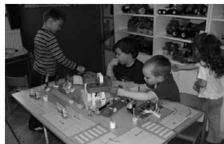
Jól működő intézményhálózat jellemzi a települést

Az idei évben az egész országban komoly károkat okozott az időjárás. Hidason is jelentős károk keletkeztek. Május közepén, június első napjaiban és június közepén igencsak megnyíltak az ég csatornái. Ritkán (szakemberek szerint százévente) tapasztalható mennyiségű eső esett, amely igencsak próbára tette településünket. Jelentős árhullám vonult le mindhárom alkalommal. Az árhullám jelentős károkat okozott az Öreg-patak medrében, a körülötte levő területekben. A megáradt patak a Bányatelepen, és községünk külterületén több helyen ki is lépett medréből. A helyzetet jelentősen súlyosbította a megnövekedett talajvíz-szint, valamint az hogy a talaj felső rétege gyakorlatilag 100 %-ban telítődött vízzel. Településünkön pincék, alagsori helyiségek tucatjai teltek meg. A talajvízzel való telítődése hatására partfalaink, partoldalaink, patkamedreink számtalan helyen leomlottak, errodálódtak, több helyen veszélyeztetve ezzel köz- és magáningatlanokat. Az Önkormányzat 10 vis maior pályázatot adott be 140 millió Ft összegben. A pályázatok elbírálása a beérkezett hatalmas mennyiségű pályázat és az igényekhez képest rendelkezésre álló kicsi központi költségvetési keret miatt lassan haladt. Hidas pályázataival vegyes elbírálásban részesültek. A beadott összeg mindössze 30 %-a került megítélésre, ez 44 millió Ft. Így az Önkormányzatnak sokkal mélyebben kell majd a zsebébe nyúlnia a kivitelezések során, illetve a kivitelezési terveket újra át kell gon-