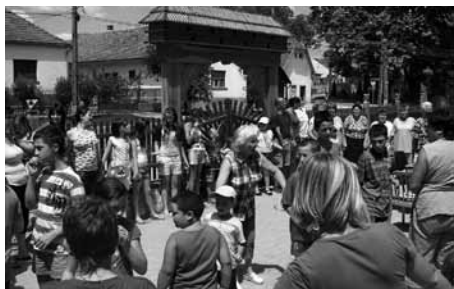
A jól működő civil szervezetek részt vállalnak a közösségi életben

zat hibajelző rendszert szereltetett a Stop csárdánál és a Coop-Áfész boltjánál levő szennyvíz-átemelő szivattyúkra. A szivattyúk ugyanis a nagy esőzések során a szennyvízhálózatba kerülő jelentős mennyiségű víz miatt többször leálltak, emiatt a több környékbeli lakó esetében szennyvíz-visszáramlás volt tapasztalható. Szintén e hónapban megkezdtek az Öregpaták részűjén a vágóhíd mellett keletkezett károsodás javítását, köszöréssel történő megerősítését.