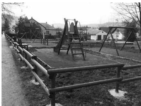
Térfigyelő kamerarendszer „örzi” a várva várt, jól felszerelt játszótérrel

módosulása, és alapos előkészítés után 2010. év végén a kivitelezői szerződések aláírásra kerültek, így idén a Bányatelepen, a Művelődési Ház melletti parkban megkezdődhetett a rég várt létesítmény elkészítése. A szűkös elszámolási határidőre való tekintettel január végén elkezdődtek a kivitelezési munkálatok és az időjárásnak köszönhetően a terepmunkálatok, a játékok telepítése, a játszótér kerítésének építése két hét alatt megtörtént. Az elkészült játszótéren helyet kapott több hinta, rugós játék, csúszda, kombinált fa játszótéri eszköz, egyensúlyozó játék, sőt mozgáskorlátozott gyerekek által is használható játszótéri eszköz is. A szülők kényelmét fapadok biztosítják.