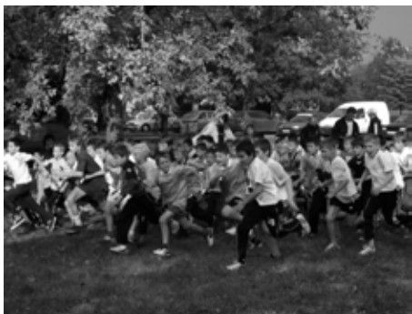
Tömegrajt az alsós fiúknál

A túratársak elmondása alapján lejegyezte: Dr. Novotny Iván