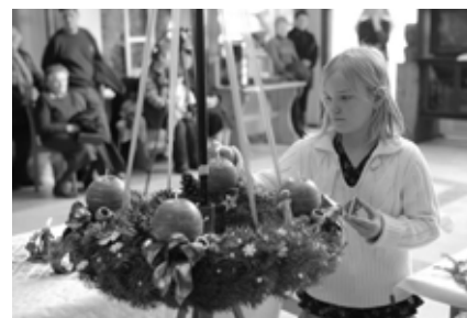
A fotó a Német Barátsági Egyesület adventi rendezvényén készült 2010. november 27-én.