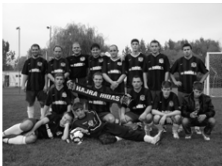
A sikerek miatt újra fociláz van Hidáson