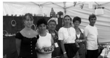
Az egyesület tagjai a Budai Várban

A háromnapos táborban 59 gyermek és 25 felnőtt volt részt. Többen voltak olyanok, akik már jártak a táborunkban, de ez évben Budapestről és Győrből is érkeztek fiatalok. Mindenki nagyon jól érezte magát,