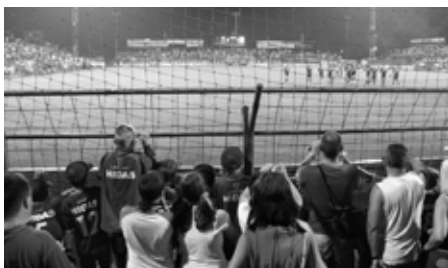
A Loki focistái a szektorunkhoz jöttek megköszönni az „aktív részvételt”

Így elmondható, hogy a csoportmeccsek először csalódást okoztak, de később kiderült, hogy ebben a nehéz kvartettben a