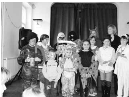
Kíváló hangulatú rendezvények színesítik az óvodai-iskolai életet – például a jelmezbál

Sikerült kiharcolni, hogy emelt óraszámú kapjanak az óvodás gyermekeink logopédiai és fejlesztő pedagógusi foglalkozásokat. Ez annál is fontosabb, mivel óvodánk integrált intézményként működik, éppen ezért kiemelt figyelmet fordítanak az ide járó gyermekek nevelésére, fejlesztésére.