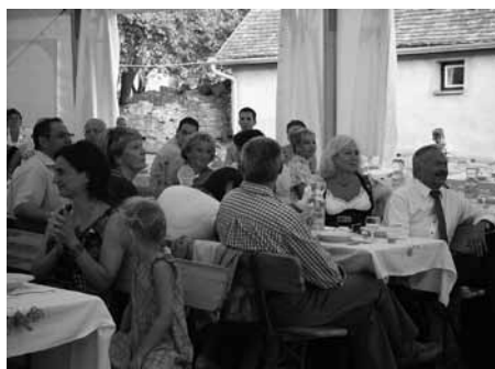
Unterschleißheimi és helyi vendégek élvezik a színvonalas műsort

Nyertes LEADER - pályázatból 2010-ben bekerítjük a katolikus temetőt és a ravatalozó előtt a jelenleginél nagyobb terület lesz szilárd burkolatú.