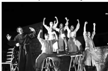
Szent István napok – a város egyik kiemelt rendezvénye

Korábban többször is utalt rá, hogy a kulturális nagyrendezvényeket szeretné a jövőben megtartani. Ez azt jelenti, hogy nem szeretne spórolni ezeknek az eseményeknek a költségein, vagy pedig azt, hogy továbbra is mindegyik megrendezésre kerülne, de alacsonyabb keretösszegekkel?