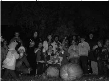
Az erzsébeti gyerekek lampionokkal és tóklámpákkal

Vidám mulatságban sem volt hiány. A gyerekek nagy örömeire több településen (Lovászhetény, Mecseknádasd, Erzsébet,