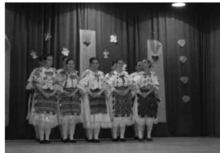
Szín pompás horvát viseletben a kátolyi lányok

Erzsébet és Katalin nemcsak két kedvelt név ünnepe, hanem egyes községek búcsúja is. Különösen látványos a kátolyi hagyományőrző búcsú programja, hiszen a térségben egyedülálló horvát néphagyományt őrzi.