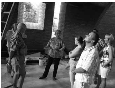
Kincskereső úton a kerekasztal - látogatás az azóta felszentelt kékesdi templomban

Elfogadta a Szociális Szolgáltatástervezési Konceptiót, valamint a Pécsváradi Kistérség 5-8 éves középtávú Közoktatási-Fejlesztési Tervét. E tervek megléte és aktualizálása szükséges az önkormányzatok által a jövőben beadandó pályázatokhoz. Kistérségünk a „Közkinccs kerekasztal létrehozása a Pécsváradi Kistérségben” című pályázaton 353 000 forintot nyert el, melynek elszámolása rendben megtörtént. Ezúton is köszönjük a lelkes közreműködőknek munkájukat, segítségüket.