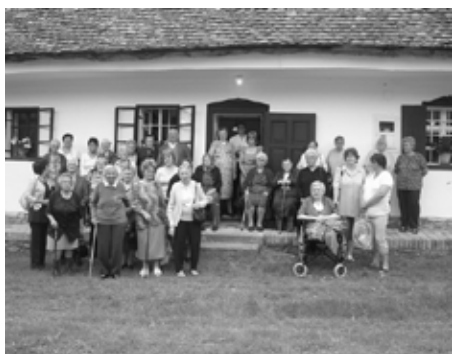
A Tájház udvarában készült csoportkép

A kapcsolat a két intézmény között szorosnak ígérkezik, hiszen a jövőben a hidasiakat tervezik, hogy Mecseknádasdra látogathassanak.