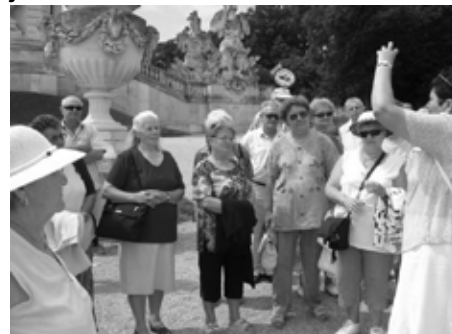
Schönbrunnban az idegenvezetőnkkel