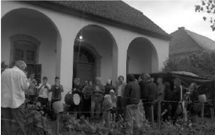
(A Nagypalli Pince Galériáról a 16. oldalon olvashatnak még - a szerk.)

A megnyitó után a Nagypalli Négyelet tagjai ismét finom babgulyással vártak mindenkit a házigazda udvarában.