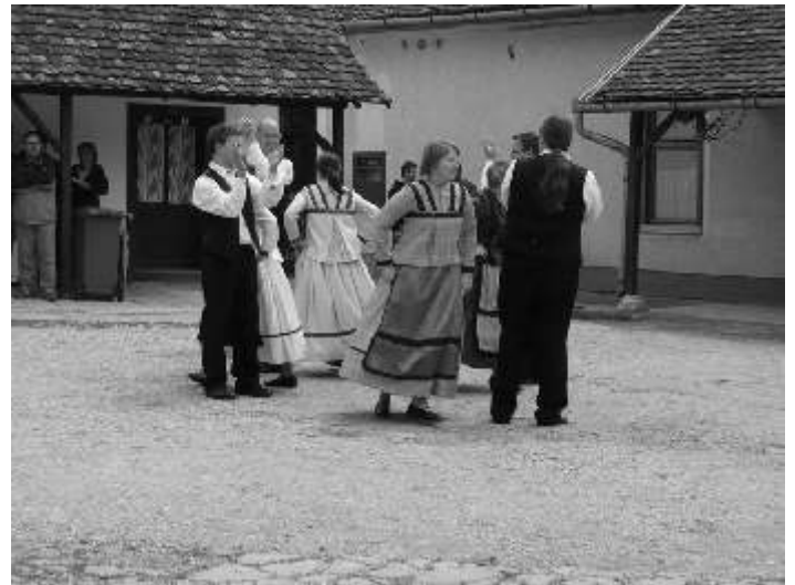
Az Ifjúsági Táncsoport fellépése