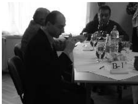
Munkában a borbírák

Természetesen a környékbeli, a kistérségben él gazdák közül is többen értek el szép eredményeket.