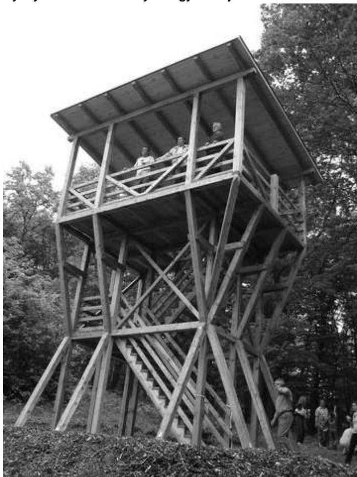
A kirándulók már birtokba vették az új kilátót

Gyönyör kilátás az óbányai völgyre az új kilátóról