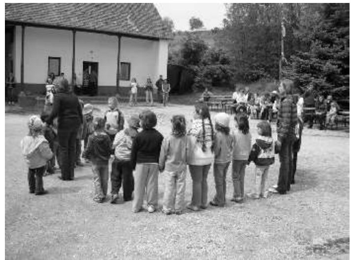
Az óvisok műsorát megragadottan nézték végig az édesanyjuk és nagymamák