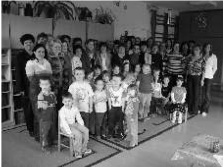
A továbbképzésen részt vett óvónk az ófalui óvodások társaságában

A Magyarországi Német Pedagógiai Intézet (Ungarndisches Pädagogisches Institut) az idén már harmadik alkalommal szervezte meg nemzetiségi óvónk és alsó tagozatos némettanárok részére 30 órás akkreditált továbbképzését.