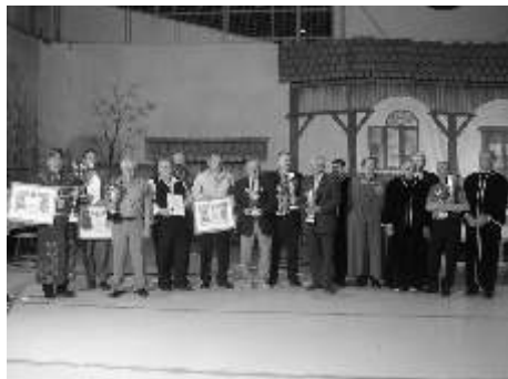
A díjazott borosgazdák, borászok