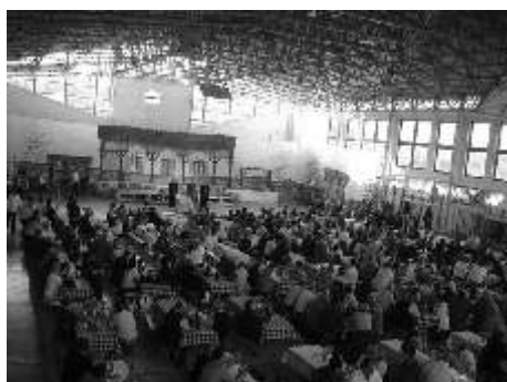
Ismét teltház volt az ünnepélyes eredményhirdetésen