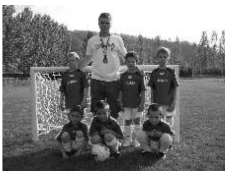
A hónapról hónapra sikeresen szerepl hidasi gyermekcsapatok és edz ik