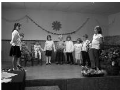
A felvétel tavaly, a fazekasbodai gyermekek anyák napi m során készült