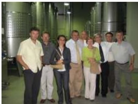
hivatalos látogatáson a képvisel testület Pannonhalmán 2008. júniusában

után április 23-án, a 2009. évi Szent György Napok felvezetéseként kerül sor a hivatalos kapcsolat-felvételre Pannonhalma városával. Nem csupán a bencés kolostor a közös pont a két településnél, de a hasonló méret, a hasonló intézményi rendszer, a kistérségi központi szerep is. Az élénk pannonhalmi civil életben is bizonyára rátalálnak a pécsváradi szervezetek is az együttműködés lehetőségére. A delegáció április 22-én érkezik Pécsváradra.