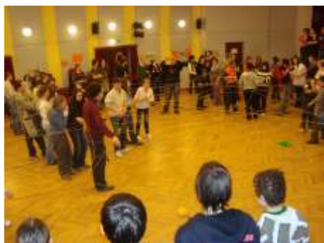
Kapcsolatok hálójában a "fonalas" játékban a fiatalok feltárták, hogy hány gyermek és ifjúsági önkormányzattal van kapcsolatuk az ország más részein