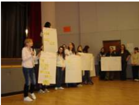
A kiscsoportos munka eredményeinek prezentálása a nagyközönség előtt