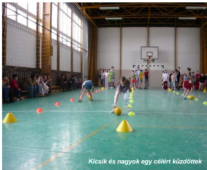
Kicsik és nagyok egy célért küzdöttek

Játékos sportvetélkedő: együtt a 8 évfolyam!