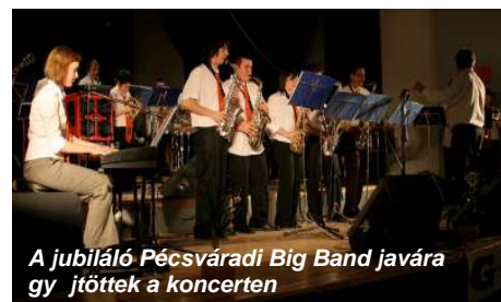
A jubiláló Pécsváradi Big Band javára gy jtöttek a koncerten

Példaérték , rendkívül magas színvonalú és felejthetetlen szórakoztató koncertet rendezett az APSONS családi zenekar a 10 éves jubileumát ünnepl Pécsváradi Big Band javára. A m sorban az említett zenekarokon kívül két pécsi együttes is fellépett, a Vivát Bacchus és a Bach Singers valamint a négy együttesb l kifejezetten erre az alkalomra verbuválódott formációk, szólóprodukciók.