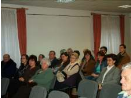
A felvétel a tavalyi rendezvényen készült

A Mecseknádasdi Német Kisebbségi Önkormányzat sok szeretettel meghív minden érdekl d t a „ Nemzetiségi életünk tegnap és ma ” cím el adássorozat utolsó programjára.