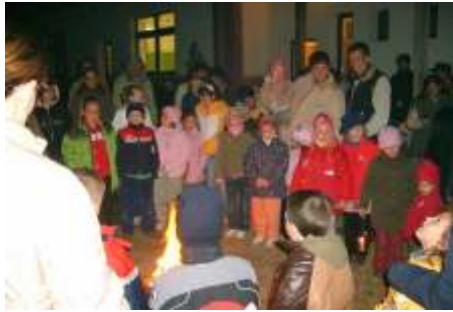
Az iskola udvarában kicsik és nagyok mind körbeállták a tüzet

megújításra szorul. A nevek újrafestése, a fűgák javítása id szer vé vált. Ugyancsak javításra, tisztításra szorul a fels város terén álló Kossuth szobor , amely 1911-ben, Baranya megyében harmadikként került felavatásra Pécsváradon. Eredeti helyér l 1930-ban került a mai Kossuth-terre, miután helyét az l. világháborús emlékm foglalta el. Mindkét emlékhelynél a szervezés feladatát, a munkák megrendelését a Kör vállalja. A programot a város vezetése támogatja.