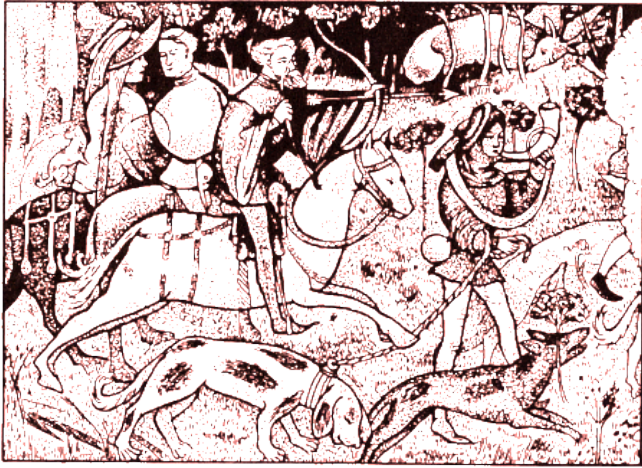
Vadászjelenet a runkelsteini falfestményről