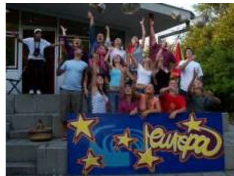
A felvétel a tavalyi táborban készült, Unterschleissheimben

A Kistérségi Társulás nevében a Pécsváradi Kistérségi Fórum benyújtott egy pályázatot az Európai Bizottsághoz a találkozó finanszírozására.