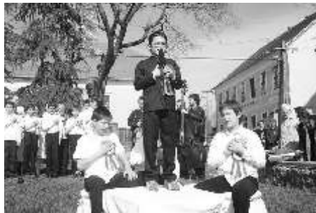
Jelenet a Kodolányi János Általános Iskola diákjainak sorából

Az jelenlétükben nyílt meg a Várostörténeti Múzeumban a „Felvidékiek Pécsváradon” című kiállítás a Várbaráti Kör szervezésében. (Részletek a 10. oldalon.)