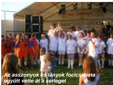
Az asszonyok és lányok focicsapata együtt vette át a serleget

A tavalyi fesztivált is meghaladó érdeklődés övezte a Hidasi Bányásznapi rendezvénysorozatát augusztus 31. és szeptember 2. között. A hidasi sportpályán felállított