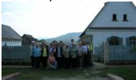
Fotó: Vörös Márta