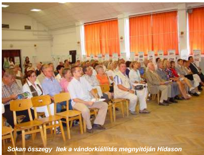
Sokan összegy ltek a vándorkiállítás megnyitóján Hidason