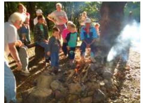
T gyűjtás a Zeng n

Nemcsak Pécsváradról és Hosszúhéteny b l, hanem Kecskemétr l és Debrecen b l is indultak túrázók szeptember 22-én, szombaton a Zeng re. Valamennyi mecseki csúcson ott voltak a természetvé d k és 17 órákor egyszerre gyűjtöttak tüzet a Zeng n, a Hármashegyén, a Misinán, a Tubesen és a Jakab-hegyen, továbbá Óbányán. Ez a hagyomány eleven volt a két háború közt, 2005 óta pedig az Állampolgári Részvétel Hetének keretében teszik meg az szí túrát, hogy felhívják a figyelmet a hegyet fenyeget veszélyekre.