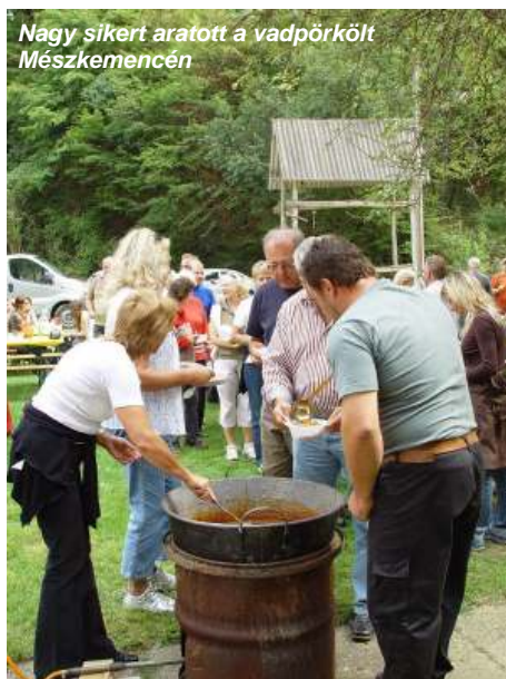
Nagy sikert aratott a vadpörkölt Mészkemencén

Köszönet a Partnerkapcsolati Bizottság közrem köd tagjainak! A következ hivatalos látogatás a tervek szerint 2008 júniusában lesz: az unterschleißheimi Stadtkapelle jubileumi ünnepségére várnak egy delegációt a Zeng aljáról.