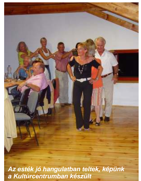
Az esték jó hangulatban teltek, képünk a Kulturcentrumban készült