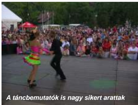
A táncbemutatók is nagy sikert arattak

színpad és fesztiválsátor rengeteg kulturális és szórakoztató programnak adott otthont. Pénteken a karaoke versenyre voltak a legtöbben kíváncsiak, de aznap utánpótlás focimeccs, pókerverseny, Tátika-show, énekkar, zenei tehetségkutató, illetve éjjeli diszkó is szerepelt a műsorban. Szombaton fotókiállítással mutatkozott be a kistérség testvértelepülése, Unterschleissheim, majd a két-nyelvű kulturális műsor után a motorosok zajos toborzó felvonulással járták be a falut. A focimeccs verseny közben gyermek sorsolást, játszótér, szépségversenyt, báb- és szabadtéri színházat, néptáncot és modern táncot láthattunk a színpadon. Késze délutánra megint népes közönség gyűlt össze a helyi asszonyok és lányok focimeccsére, majd az esti bál előtt a Groovehouse együttes és Fenyő Miklós adott koncertet a közel kétezres tömegnek. Vasárnap a Bányászemléknap ünnepélyes