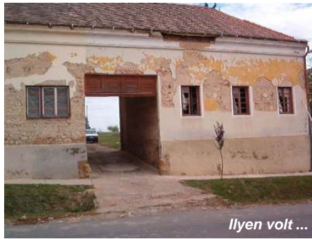
Ilyen volt ...

romos állapotú, régi kocsmáépület egyik szárnyából kialakított házasságkötő terem . A felújítás során a teljes homlokzat is megújult. A beruházás összértéke 9.754.000 Ft, melyhez 5.000.000 Ft regionális pályázati támogatást nyert az önkormányzat. Az épület másik szárnyának hasznosítása külön feladat, melyhez szintén pályázati támogatást keres majd az önkormányzat.