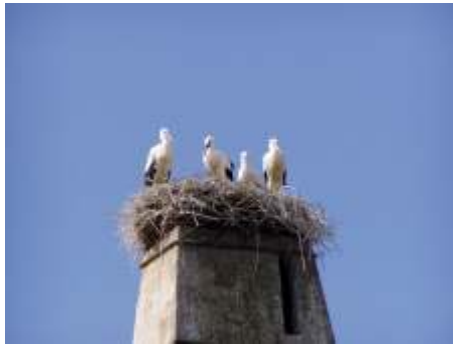
Fotó és szöveg: Dretzky Katalin

már használaton kívüli kéményén. Évente egyre többen figyelték életük alakulását, érkezésüket, a kiscigolyák számának alakulását, felnevelését. Ritka gazdag év volt az idei. Négy pompás fiókat nevelt a szemünk láttán, nem kis munkával a gólyapár. Aztán a kezdeti szárnypróbálgatásokat követte az egyre hosszabb repülés, majd a nyár végét jelz eltávozásuk... Bízunk visszatértükben!