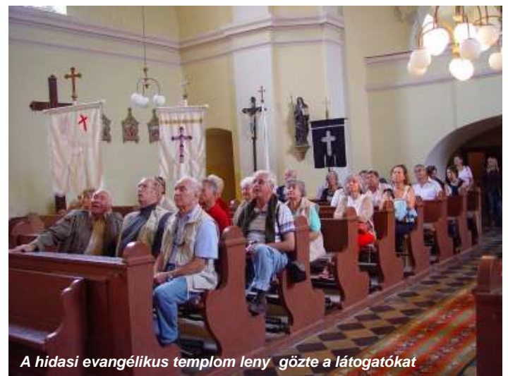
A hidas evangélikus templom leny gözte a látogatókat