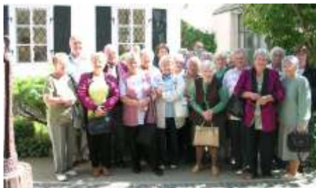
Szentendrén a Kovács Margit Múzeumban és a hidasi tájház el tt Skanzenben