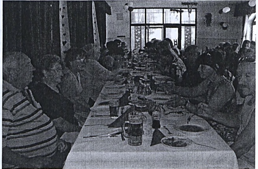
Jó hangulatban telt a találkozó

Ezen program keretében terveznek megemlékezést a települések testvérkapcsolatának 10 éves évfordulója alkalmából.