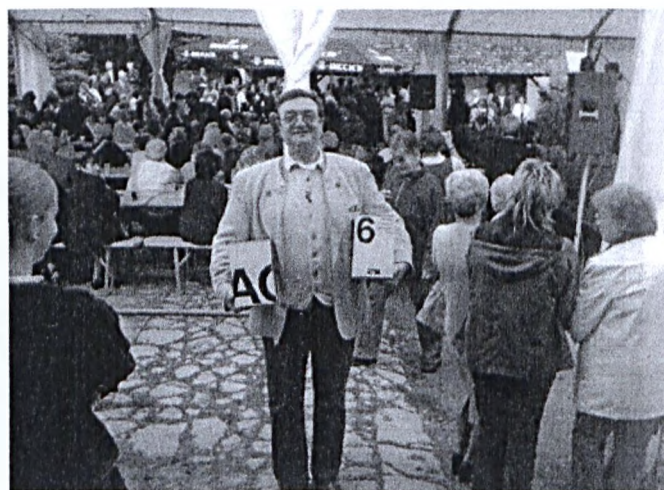
Az utolsó felajánlás is megérkezett a tombolához

2006. augusztus 25-én, 9 - 12 óra között a pécsváradi művelődési házban tart kiszállásos VÉRADÓNAPOT a Komlói Véralóállomás A nyári időszakban, amikor sokan szabadságon vannak sajnos csökken a véradók száma. Ugyanakkor ebben az időszakban egyre több a baleset és több vérre van szükség. Kérjük segítsen!