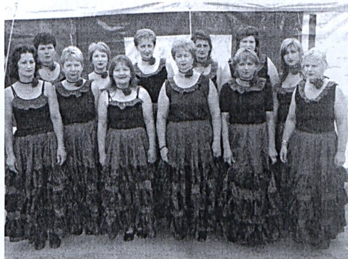
Az élet lehet ilyen is, 40-en innen és túl - mondják a nagypalli asszonytornások