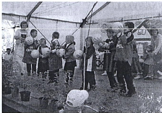
A helyi óvodások táncos, verses szereplésük után FOCIVB-s hangulatot teremtettek.