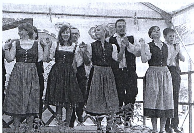
Felléptek még a helyi néptáncosok, a Manó és Barátai Szaxofon Quartett, énekeltek fiatalok és idősebbek egyaránt.