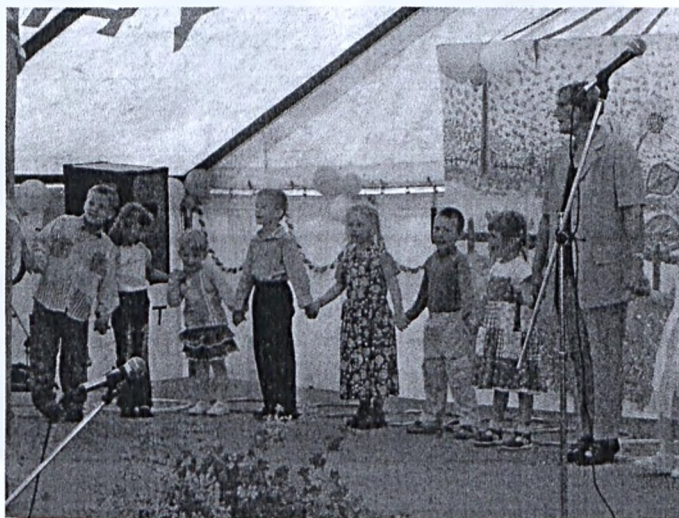
A helyi óvodások műsora

A szervezők - Lovászhétyi Község Önkormányzata, Német Kisebbségi Önkormányzat és a Lovászhétyi Egymásért Nemzetiségi Közhasznú Egyesület - ezúton is köszönik a helyi aktivisták és támogatók segítségét.