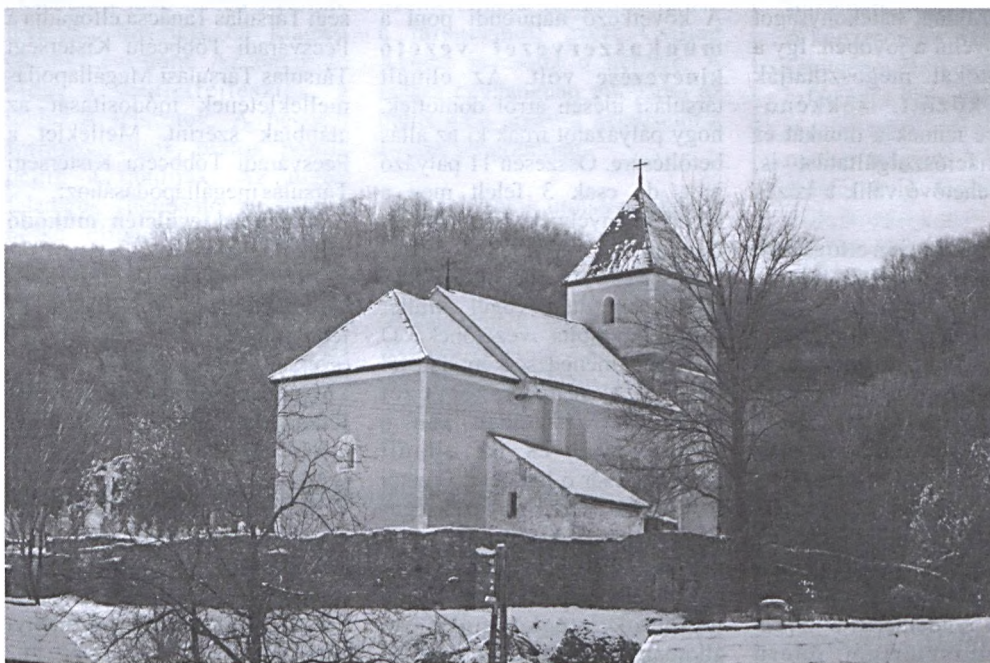
Szent István kápolna (Mecseknádasd)

Aldott békés Karácsonyi Ünnepeket és sikeres, boldog Új Esztendőt kívánunk a térség minden Kedves Lakójának!