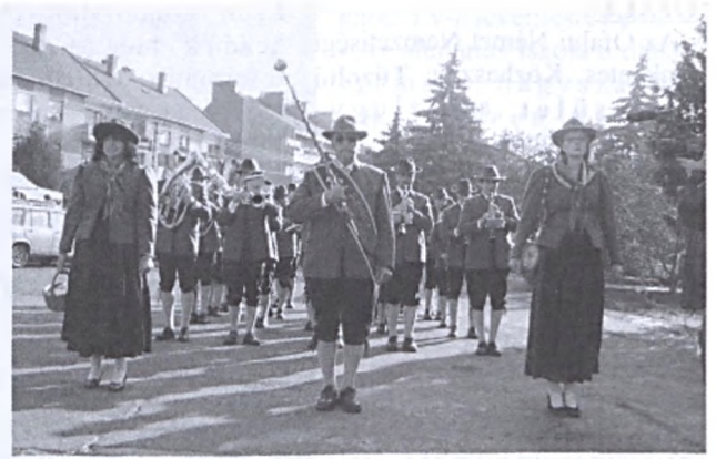
Részletek a "Gesztenyeszüret a Zengő alján - Pécsvárad, 2005. október 14-15." programból