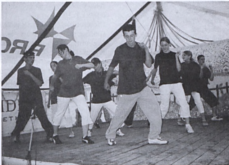
Középen a két hónapja alakult Dodo Dance Promotion Nagypalli Táncstúdió.