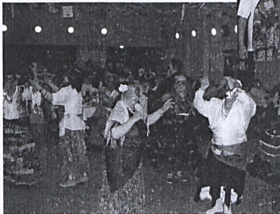
A pécsváradai nyugdíjasklubban