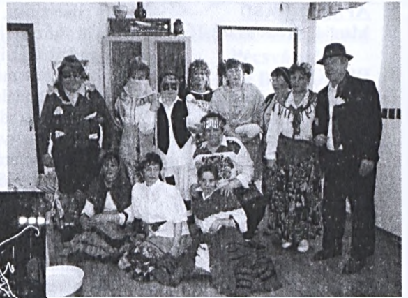
A pécsváradai gondozási központban