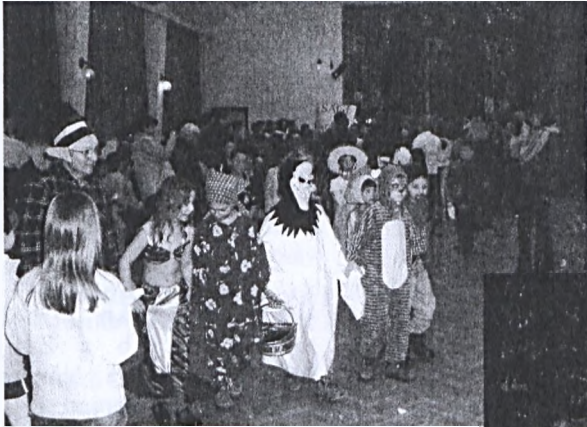
Általános iskolások Hidason