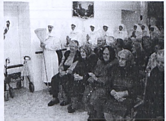
A mecseknádasdi gondozási központban