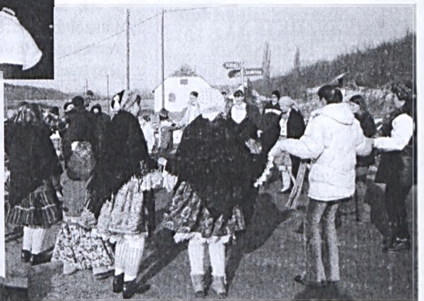
Kátolyi táncosok a község határában