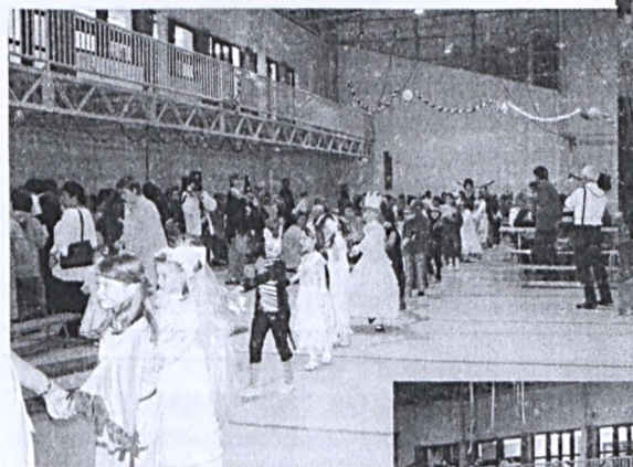
Általános iskolások Mecseknádasdon