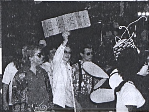
Általános iskolások Pécsváradon