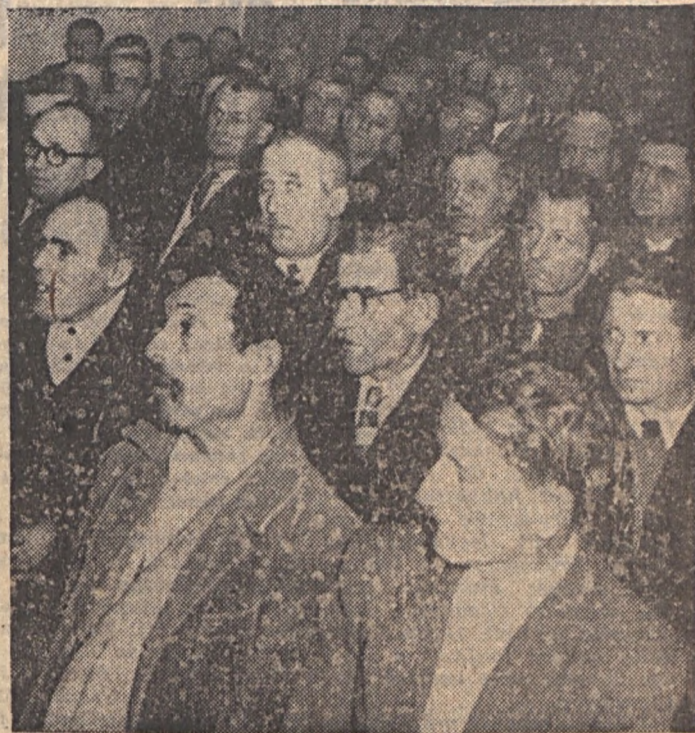
Az obsitosok egy csoportja.

Bensőséges ünnepség színhelye volt vasárnap a Május 1. Művelődési Otthon kiselőadó terme. A járási katonai kiegészítő parancsnokság rendezésében itt került sor az 1911-ben született férfiak búcsúztatására, az „obsitlevél” átadására.