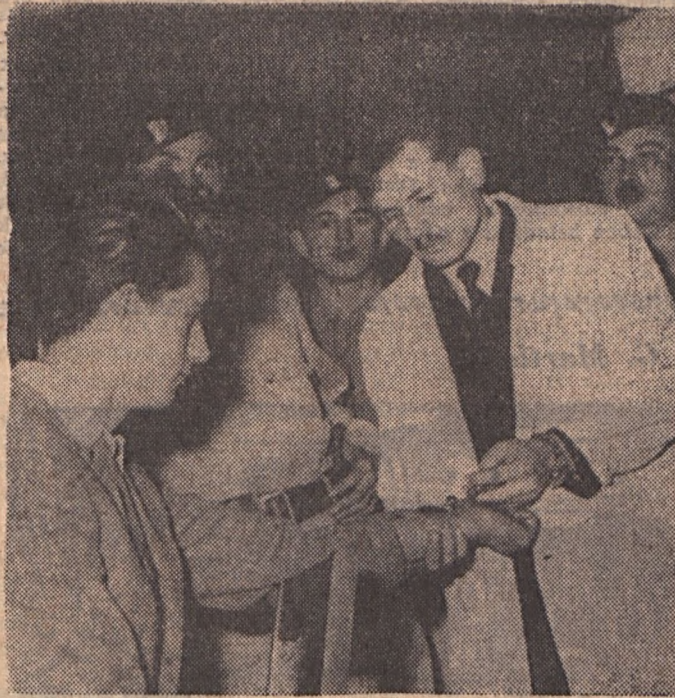
Jelenet a Vallatás című darabból.

A bemutatózó négy csoport közül elsőnek az Ifjúsági Színpad együttese lépett fel. Lorca: Csodálatos vargáné című művét mutatták be. Ezután Mecsekfalui együttesét láthattuk a Kincses Kalendárium című összeállítással, majd Kossuth-bánya műkedvelői szerepeltek a Fekete táskás asszony című