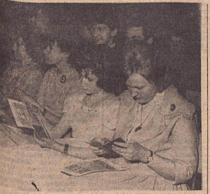
Az új személyi igazolvány-tulajdonosok egy csoportja „Sorompót értél: nem a gyöngye gyermek lép rajta át: hanem ifjú-magad.” Igy ír rólu: Kapuvári Béla Od- a tizenhatévesekhez című re-ében. Így érezték azok a fiúk, lányok, a szülők, a ven-őleg, akik vasárnap délután ttt voltak a vajúrkolói kul-túrteremben, a személyi igaz-

helyi rendőrkapitányság kép-viselője átadta a személyi igaz-olványt és az emléklapot a legjobban tanuló és dolgozó tí-zennyolc fiatalnak. A többiek — mintegy 189-en — a rendez-vény szünetében kapták meg az igazolványt. Az ünnepséget a vajúrkolói-lások sikeres kultúrműsora zárta.