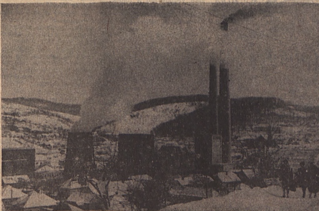
A tavasz első napja