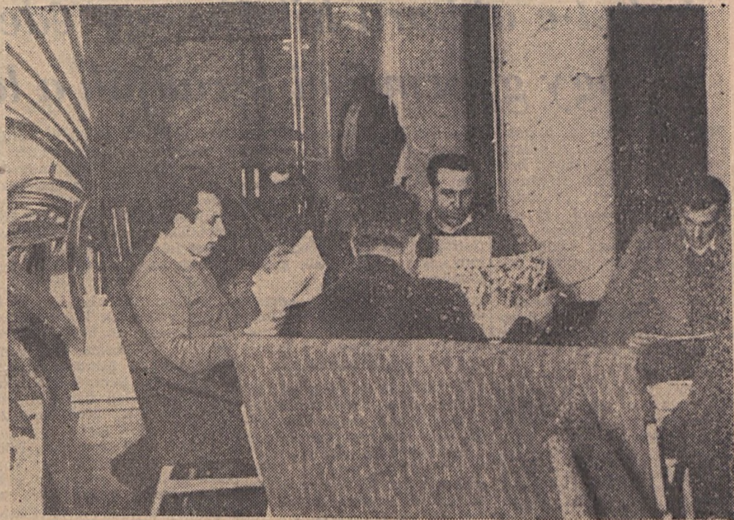
Szerdán költöztek a lakók a kölkönyösi új munkásszállóba. A modern, hangulatos társalgóban még aznap megkezdtek az ismerkedést, olvasást. (Tudósítás a 3. oldalon)