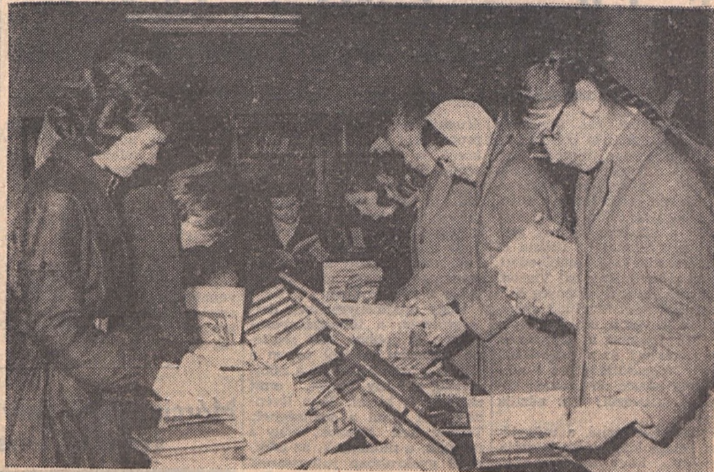
72 új könyvet állítottak ki a Zrínyi Művelődési Házban lévő városi könyvtárban. Érihető érdeklődéssel szemlélik ezt az olvasók, hiszen valamennyi kötet az utóbbi hónapokban jelent meg. Szépirodalmi alkotások mellett olyan értékes könyv is köcsönözhető, mint az új kiadású magyar irodalomtörténet, vagy a román népköltészet gyűjtemény.