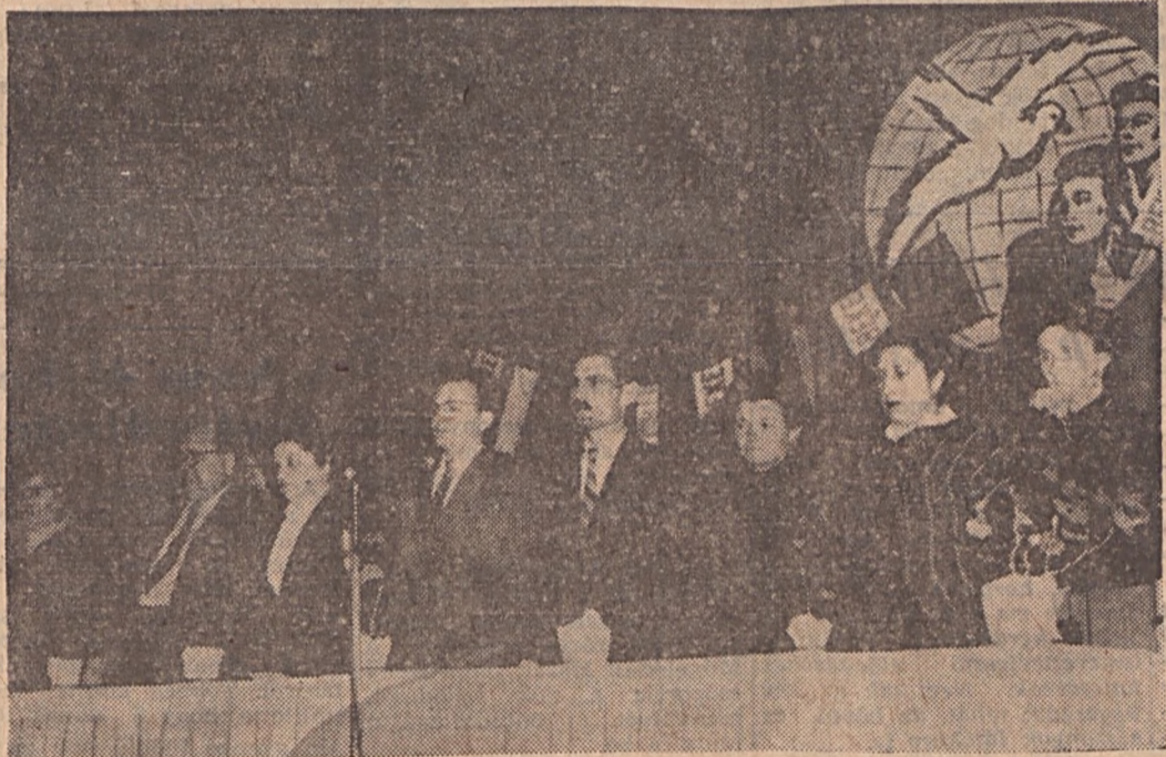
A Zrínyi Művelődési Otthonban tartott nőnap ünnepség díszelnöksége

— A Magyar Szocialista Munkáspárt Komló városi Bizottsága azt kéri Önöktől, hogy az elkövetkezendő időben még hatékonyabban tevékenykedjenek második öt éves tervünk megvalósításában.