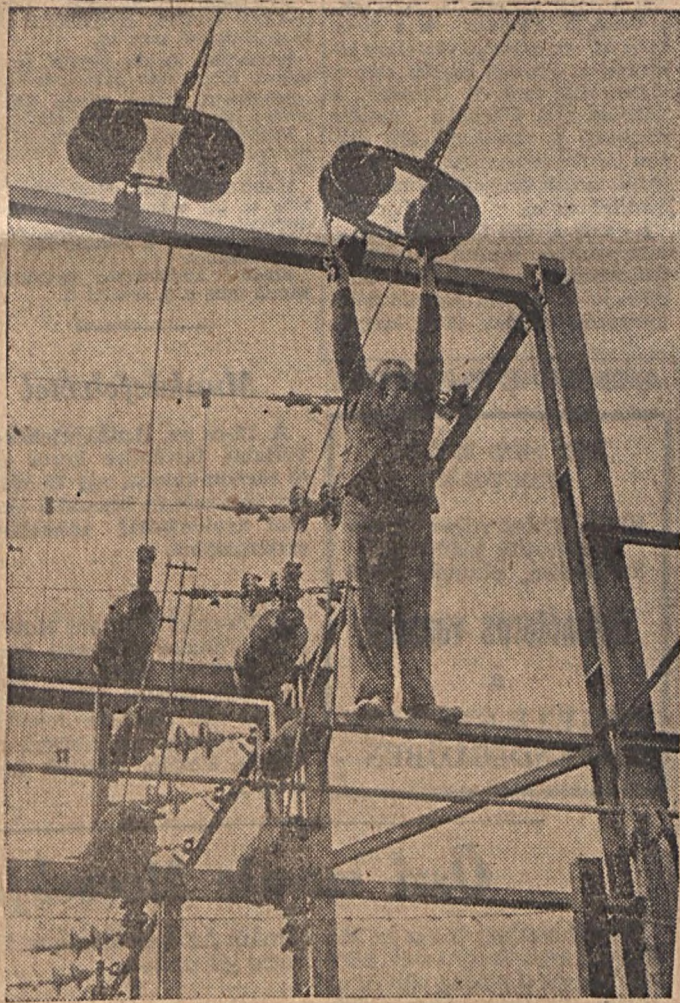
Mentőöv nélkül magasban dolgozni helytelen. (A kiállítás anyagából)

kes kis kollektíva — főként társadalmi munkában — a kiállítás anyagának elkészítésében, rendezésében. Ugy véljük, munkájukért a látogatók elismerése lesz a legnagyobb dicséret.