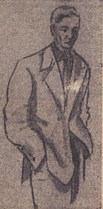
nézze meg most érkezett öltönyeinket a 117-es ruhaboltban.

Béke Szálló alagsorában lévő fürdő rövid időre szünetel.