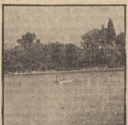
A Szénbányászati Tröszt szakszervezete biztosítja a megérdemelt üdülést. A hátralévő időben még 480 heteti igénybe a felejthetetlen élményt biztosító üdülést.

Felejthetetlen boldog két hét várja a pihenni akaró dolgozókat. Akár a Balaton partján, akár festői szépségű hegyvidéken. Az üdülés, a jó munka jutalma. A kellemes, vidám nyaralásra az méltó, aki egész évben (tavaly óta) szorgalmasan, jól dolgozott.