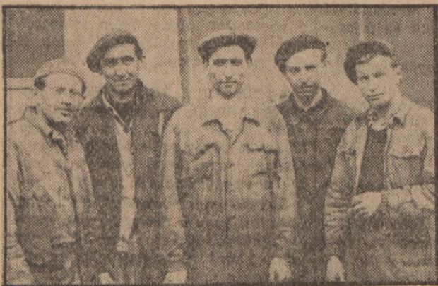
Pártunk III. kongresszusára indított nemes munkaverseny során, számos fiatal, kiváló eredményt ért el. Ezzel megmutatták, hogy méltók pártunk bizalmára

és egyben be is bizonyították pártunk iránti hűségüket.