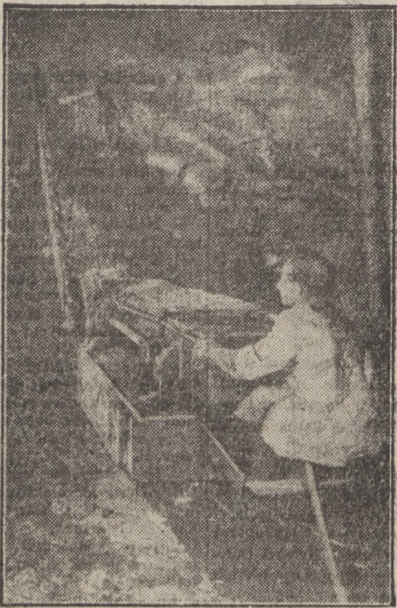
A Szovjetunió szénbányáiban minden munkafolyamatnál gépek segítik a bányászokat. Képünk a kemerovo területi „Leninugoly”-orszt „Polisztejszkaja”-i bányának egyik lejtési frontján működő univerzális réselőgépet mutatja be.