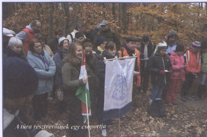
A túra résztvevőinek egy csoportja

Az idő kegyeibe fogadta november 19-én, a Skóciai Szent Margit Emléktúra résztvevőit. Hívős volt, de nem esett, és nem volt nagy köd. A tavalyi túrához hasonlóan idén is több mint háromszázan járták végig a távot Mecseknádasdtól Pécsváradig.