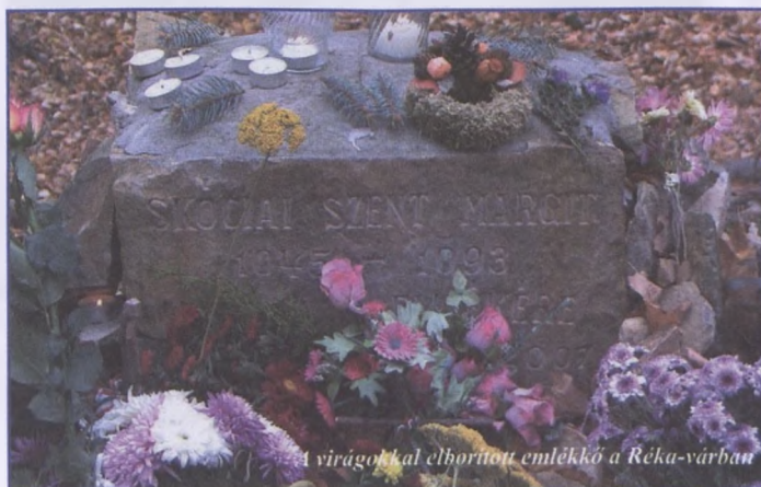
A virágokkal elborított emlékkő a Réka-várban