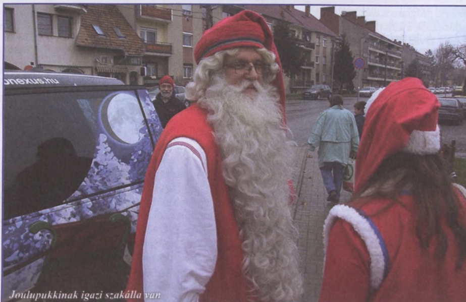
Joulupukkinak igazi szakállja van