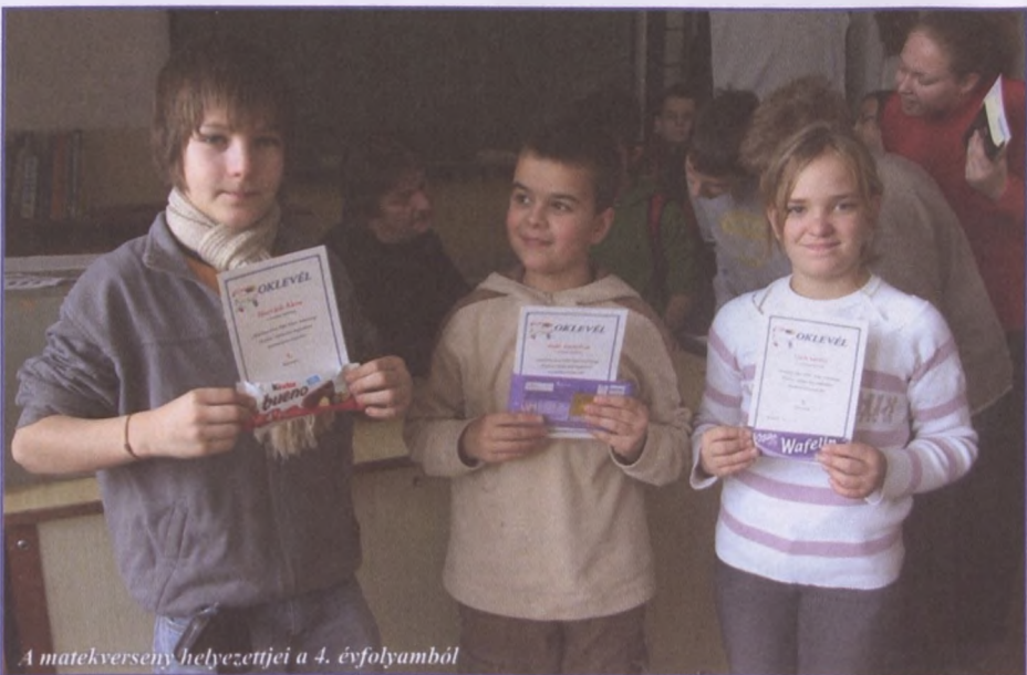
A matekverseny helyezettjei a 4. évfolyamból