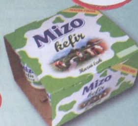
MiZo kefir 4x150 g 358,33 Ft/kg