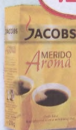
Merido Aroma kávé 250 g 1716 Ft/kg