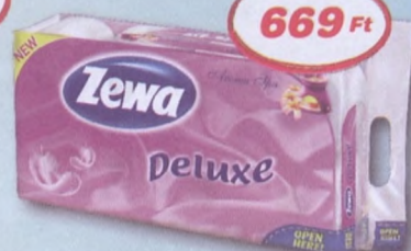
Zewa Deluxe 3 rétegű, 8 tekercses toalettpapír 5 féle 84 Ft/tekercs