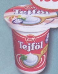
Zott tejföl 20% 330 g 469,69 Ft/kg