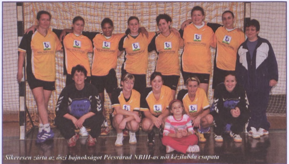
Sikeresen zárta az őszi bajnokságot Pécsváradi NBII-as női kézilabda csapata