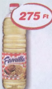
Familla napraforgó étolaj 1 l