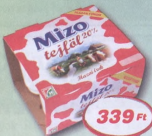
MiZo tejföl 20% 4x150 g 565 Ft/kg