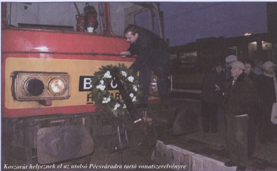
Koszorút helyeznek el az utolsó Pécsváradra tartó vonatszerelvényre