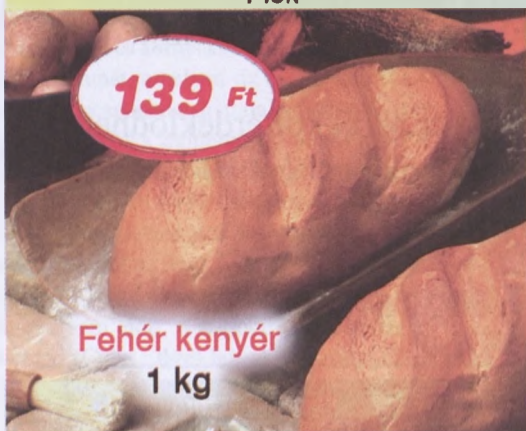
Fehér kenyér 1 kg