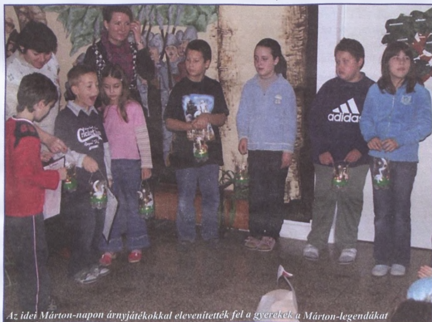
Az idei Márton-napon árnyjátékokkal elevenítették fel a gyerekek a Márton-legendákat