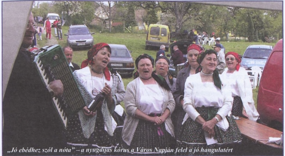
„Jó ebédhez szól a nótá” – a nyugdíjas kórus a Város Napján felel a jó hangulatért

Idővel sorra alakultak az idősekből álló kulturális csoportok: az asszony tánckar, a férfikórus, a német kórus és a vegyes kórus fellépései igazi színpontjai a helyi kulturális életnek. Ezek a csoportosulások jó alkalmat kínálnak arra, hogy továbbvigyék a nyugdíjasklub híreit a régió túlra, hiszen gyakran szerepelnek megyei, regionális és országos rendezvényeken. Nem panaszkodhat a térségünkben élő idősebb korosztály a helyi programok hiányára: nem csak zenés-táncos multságokon vehetnek részt, hanem ismeretterjesztő előadásokon, fürdőlátogatásokon, országjáró kirándulásokon, rendszeres tornákon is. A farsangolás, a nőnap és férfinap, a majálison és júniális, a karácsonyi ünnepség szintén elmaradhatatlan részévé vált