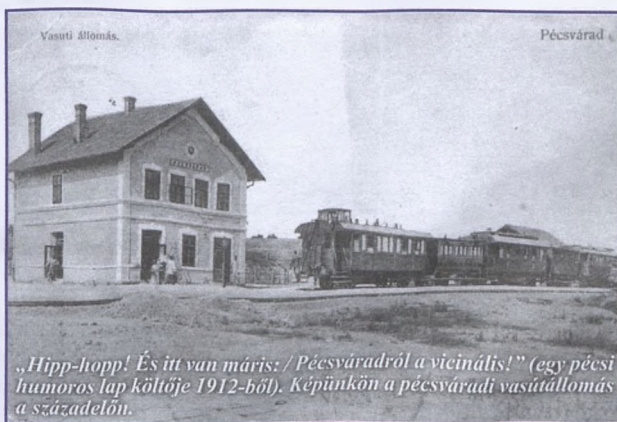
„Hipp-hopp! És itt van már is: / Pécsváradról a vicinális!” (egy pécsi humoros lap költője 1912-ből). Képeinken a pécsvárad vasútállomás a századelőn.