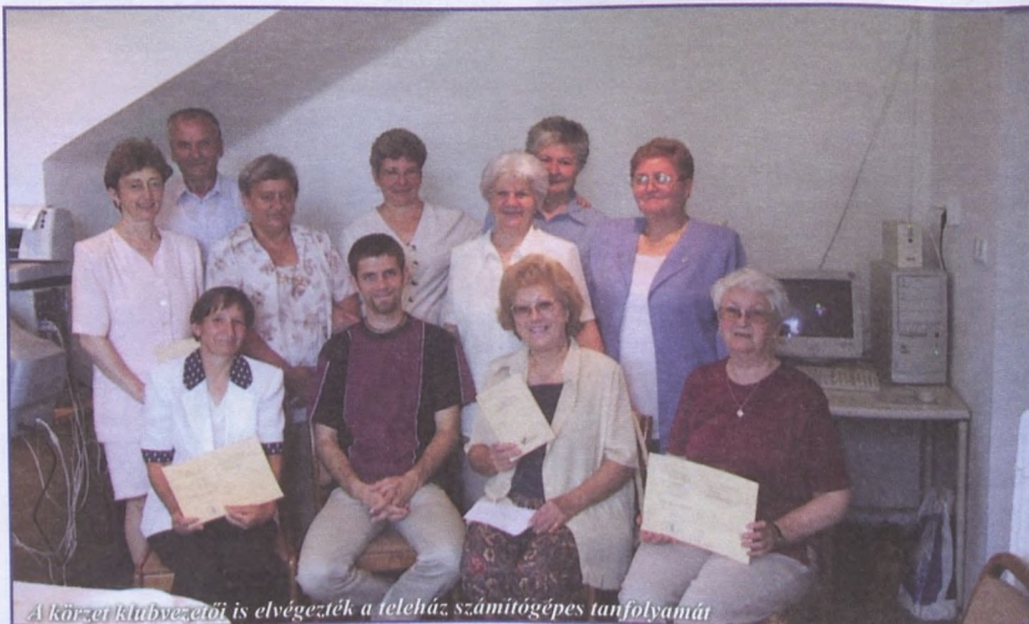
A Körzeti Klubvezetői is elvégezték a teleház számítógépes tanfolyamát