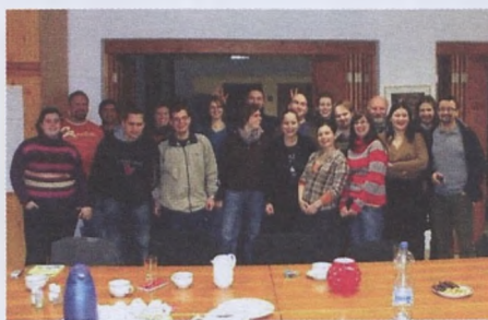
A találkozó szervezői – az ország három régiójából – januárban Mártélyban találkoztak

A régebbi közös találkozók fellendítésére, újabb tapasztalatcserére szánták el magukat a helyi gyermek és/vagy ifjúsági önkormányzatok (GYÖK vagy GYIÖK), valamint a Gyermek és Ifjúsági Önkormányzatok Társasága (GYIÖT) régi tagjai. Egy nagy