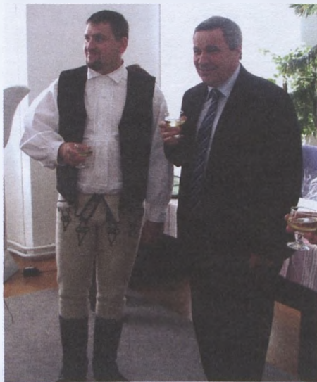
Az elmúlt év egyik kiemelkedő eseménye a máréfalvi testvérkapcsolat megkötése

Az önkormányzat a ciklusprogramjában több feladatot tűzött ki, így a központi iskola teljes rekonstrukcióját, az alsó iskola korszerűsítését (fűtés, korszerűsítés), a Vár utcai óvoda megerősítését, a művelődési ház teljes gépészeti felújítását, a város főterének teljes rendezé-