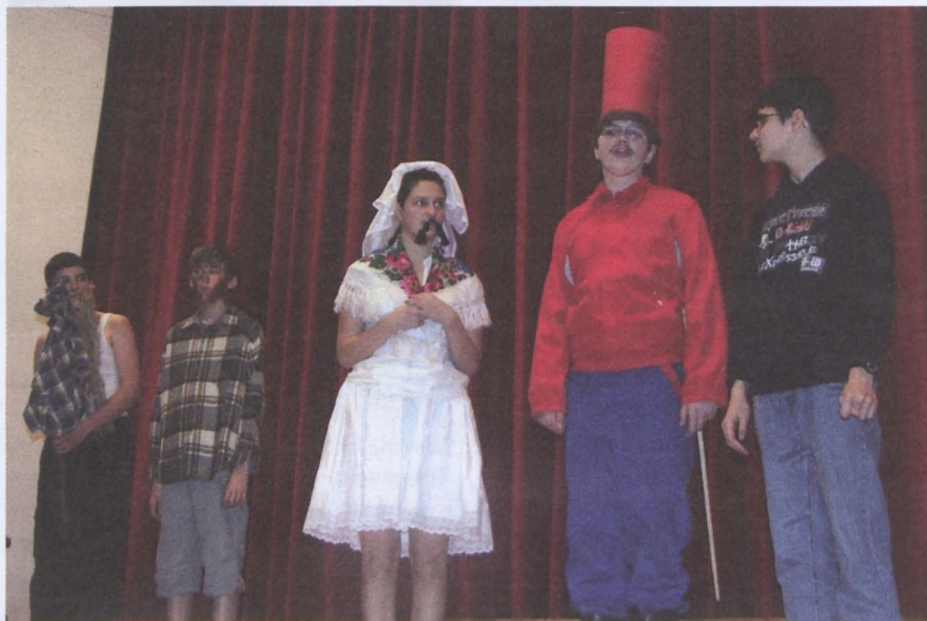
A színjátszó szakkör előadása