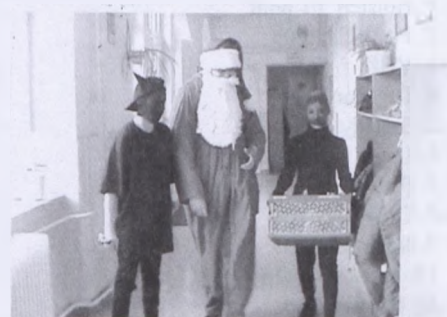
... és természetesen ellátogatott a Mikulás az általános iskolába is

A hangulat az előző évekhez hasonlóan garantált. Hozd a batyud, és bulizz egy jót az év utolsó napján!