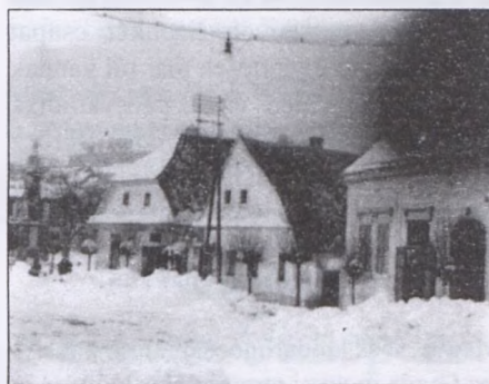
A főutca 1940 februárjában. Balról jobbra a Szentháromság tér, a Grósz-ház (rófős üzlet, pálinka-kimérés), a Jäger-ház (sütőüzem) a Grünhut-ház (bőrösüzlet), a Nékám tulajdonban levő üzletház.

Ennek védelméhez nem szükséges a "műemlék" minősítés, csak az épített örökség tisztelete szükséges, amit egyébként az egyesült Európa törvényei is megkövetelnek. Ahogyan a természeti környezet védelmét is.