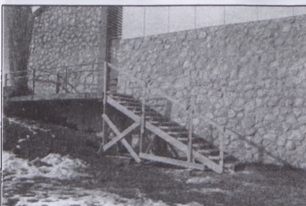
Az új lépcső a sportcsarnok hátsó bejáratánál

A pécsvárad Művelődési Központ és Sportcsarnok bővítményeként tanuszoda