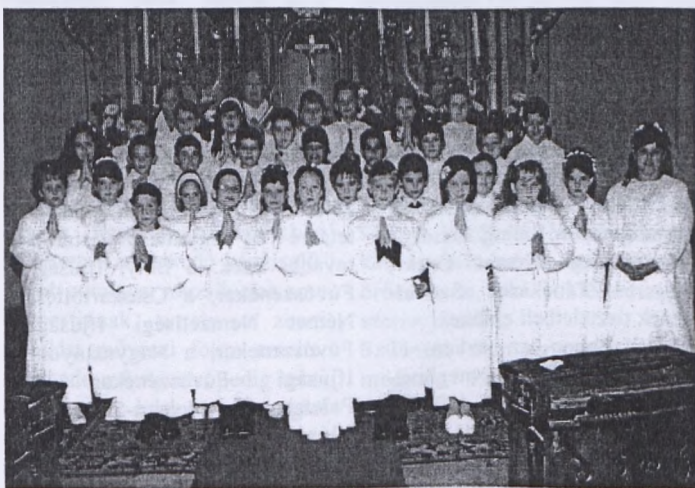
Elsőáldozás volt a pécsváradi római katolikus templomban május 23-án, vasárnap, a pécsváradi református gyülekezetben (balra), pedig konfirmáltak a fiatalok.

Az ünnepi alkalomból kiállítás nyílik: a 40 évet bemutató dokumentumaiból valamint a 45 éves Díszítőművészeti Szakkör munkáiból