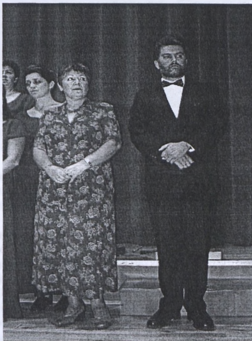
A kórus egykori és jelenlegi karnagya