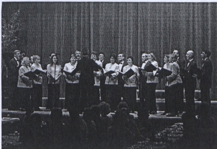
Színpadon az olasz vendégek