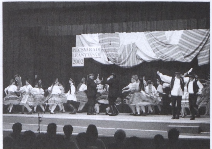
Színpadon a decsiek