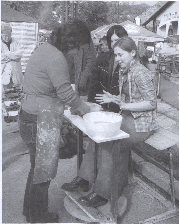
Az érdeklődők is korongozhattak a MIOK József Nándor Szakközépiskola tanulóinak segítségével