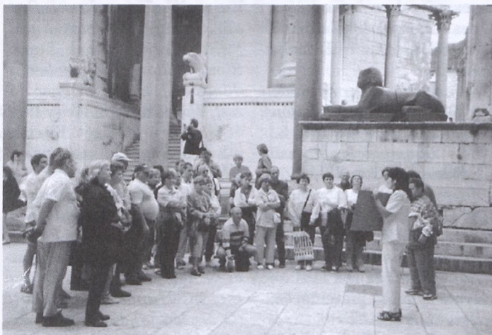
Árpád-házi királyaink nyomában Dalmáciában – 2001. Diocletianus szpatoái palotájának megtekintése