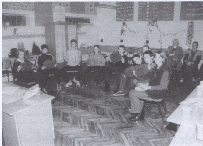
A felső tagozat osztályai december 6–20-ig rendezték meg az ajándékozással egybekötött teadélutánokat. Képünkön a 7.b osztály.

Évek óta hagyomány alsó tagozatokon, hogy a negyedikesek tanítóik vezetésével verses, zenés karácsonyi műsorral kedveskednek az alsóbb osztályokba járó tanuló társaiknak. A téli szünet előtti utolsó nap reggelén ismét hangulatos, vidám és bensőséges összeállítást