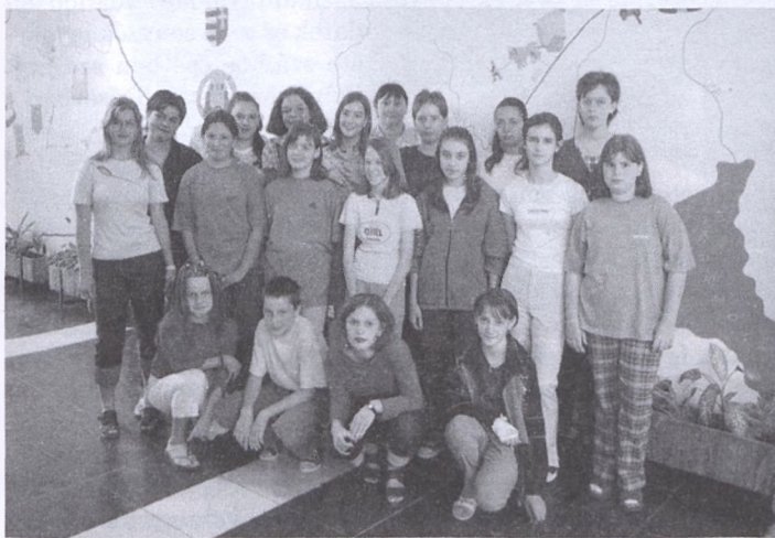
Felső képünkön a műsor szereplői, alsó képünkön az alkotók egy csoportja