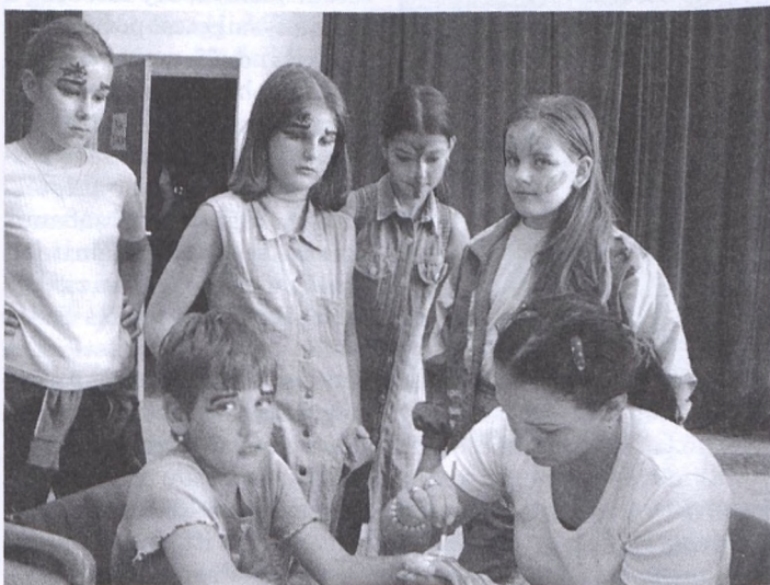
A modern technika mellett a testfestés is sokakat érdekelt

versenyek eredményhirdetésére került sor. A helyezettek különböző ajándéktárgyain kívül azonban egy kis apróság, édesség mindenkinek jutott. A nap befejezése egy fantasztikus gyermekműsor volt, amellyel a Phoenix zenekar kápráztatta el azokat, akik maradtak.