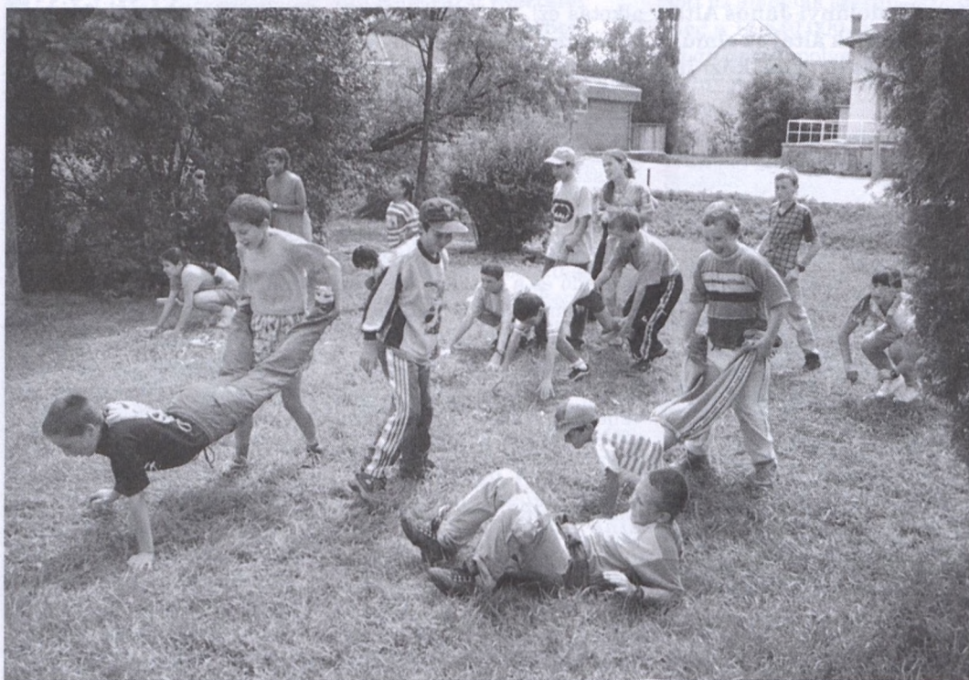
Sorverseny a szabadban