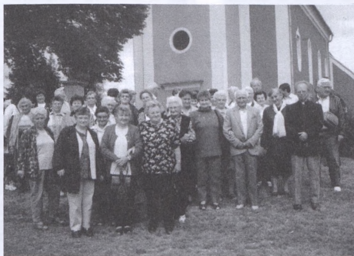
Szentpéterfán a júniusi kiránduláson

hogy a nagyon kellemes hangulatú zenés-táncos estét Pécsváradon folytatjuk. A pécsváradai nyugdíjasok még nem jártak Hausmanstättenben, ezért külön öröm számunkra, hogy