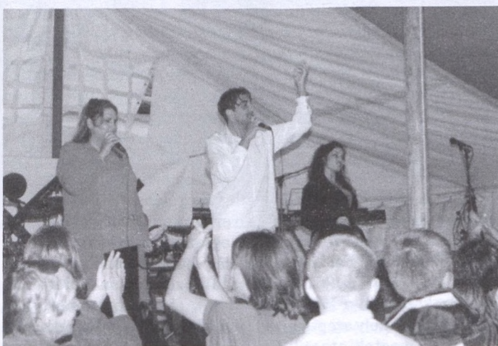
Minden napra jutott sztárvendég: először Ganxstaék, majd másnap a Romantic volt a főszereplője a fesztiválnak