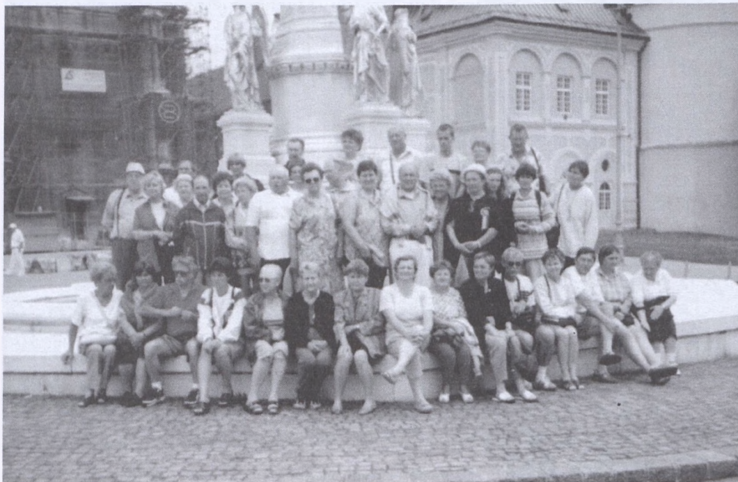
Pihenőn a kirándulócsoport Zágrábban

Nem idegenbe mentünk, csak a tengerre, melynek Árpádok voltak az urai és Zrínyiek a költői, ősi városai pedig a magyar dicsőség emlékeit idézik. Dalmáciába indult tizenhatodik útján június 15. és 22. között a Pécsvaradi Várbaráti Kör.