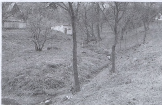
A tábor udvara

Városunk önkormányzata ismét több munkát végeztetett el köz munkásaival a téli és a kora tavaszi hónapokban. Rendbe rakták a dombay-tavi tábor udvarát, kiirtották a bozótot, kitisztították a patakot. A tábor épületén még télen elkészült a tetőszerkezet felújítása