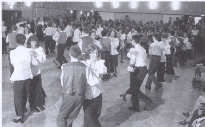
Idén április 1-jén rendezték meg a 8. osztályosok hagyományos tánciskolai záróbemutatóját, a koszorúcskát. A bemutató utáni bálon, melyen tanárok, barátok és családtagok is részt vettek, a Phoenix zenekar játszott