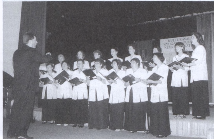
A pécsváradi női kórus a nemzeti fesztivál szakági bemutatóján

Idén tavasszal jelent meg dr. Bánszky Pál „Megújuló fagaragóhagyomány 1973–1998” című könyve, melyben több