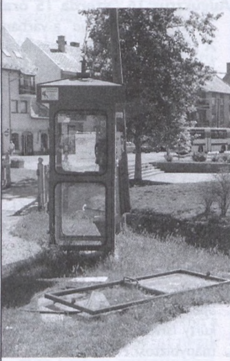
A vandálság is károsítja a környezetet

E hónap elején tartották világszerte a környezetvédelmi világnapot. Gyermekünk talán már jobban fogják óvni, védeni a természet értékeit, ha időben megtanítjuk nekik a helyes viselkedést és nem csak egy-egy dolgozatban utalnak erre, hanem a „gyakorlatban” is alkalmazzák. A világnapról szerkesztőségünk ezzel a szép verssel emlékezik meg.