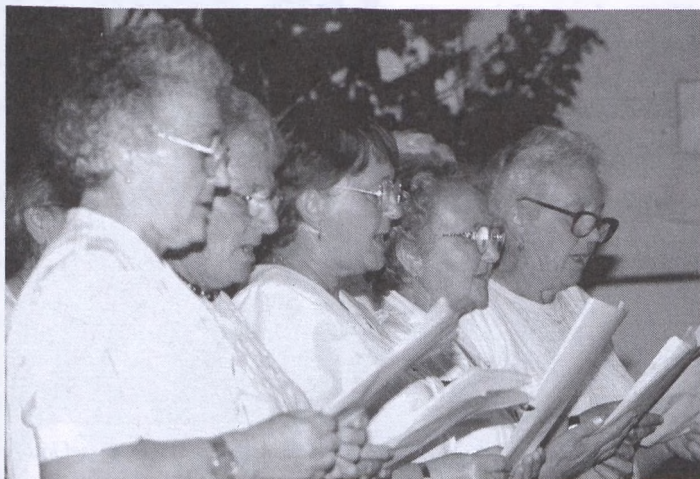
Az ófalui kórus a találkozón

A Pécsvárad Nyugdíjas-klub szeptember 25-én rendezte meg a Nyugdíjasklubok Nemzetiségi Találkozó-ját a Pécsvárad Művelődési Központban. A találkozót hagyományteremtő szándékkal rendezték meg, és mivel óriási érdeklődést és közönségikert arattak a műsorok, valószínűleg a jövőben is rendeznek hasonló találkozót.