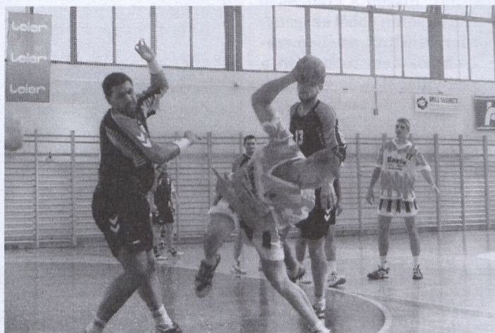
Jól kezdte az idényt a Pécsvárad Spartacus NB I/B-és kézilabda csapata

Súlylökés I. hely Gerelyhajítás II. hely Magasugrás II. hely Távolugrás VI. hely