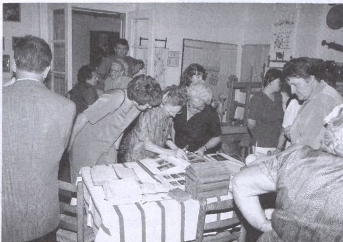
A kiállítást nagy érdeklődéssel látogatták a helybeliek