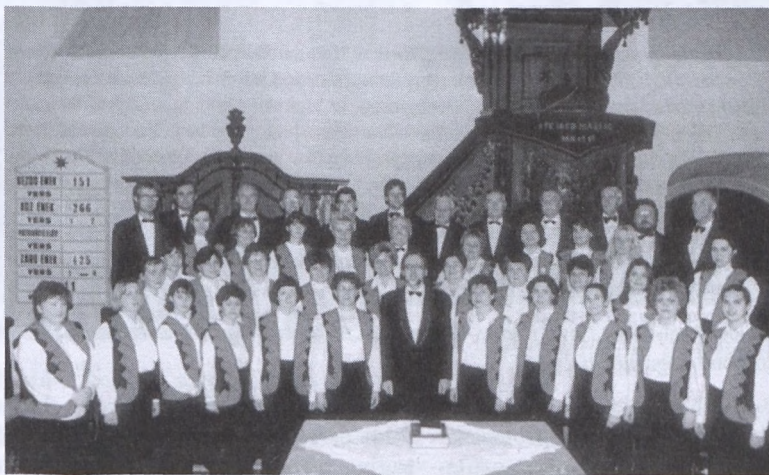
A programok egyik résztvevője a Komáromi Concordia Vegyeskar

15.00 Pécsváradi Spartacus–Komárom NB I. B férfi ifi kézilabda