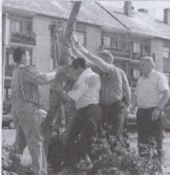
A férfiak munka közben