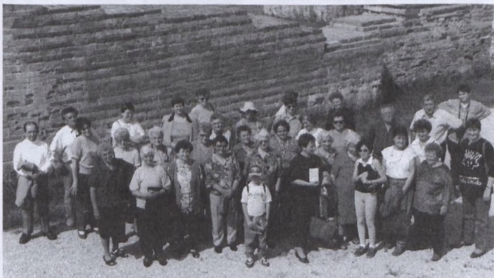
Képünkön a kör tagjai a somogyvári apátság romjai előtt