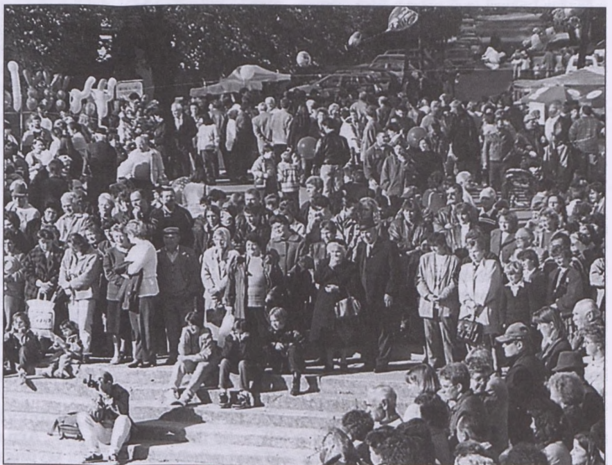
Népes közönség az idei gesztenyeszüreten