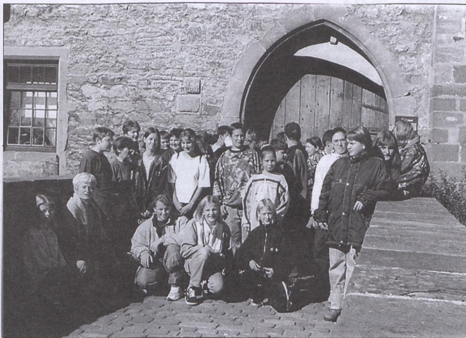
Külsheimben jártak tanulóink a szokásos diákcserén. Képünkön a várkapuban

órákat tartottunk a 3 első osztályban a szülők és érdeklődő kollégáink részére.