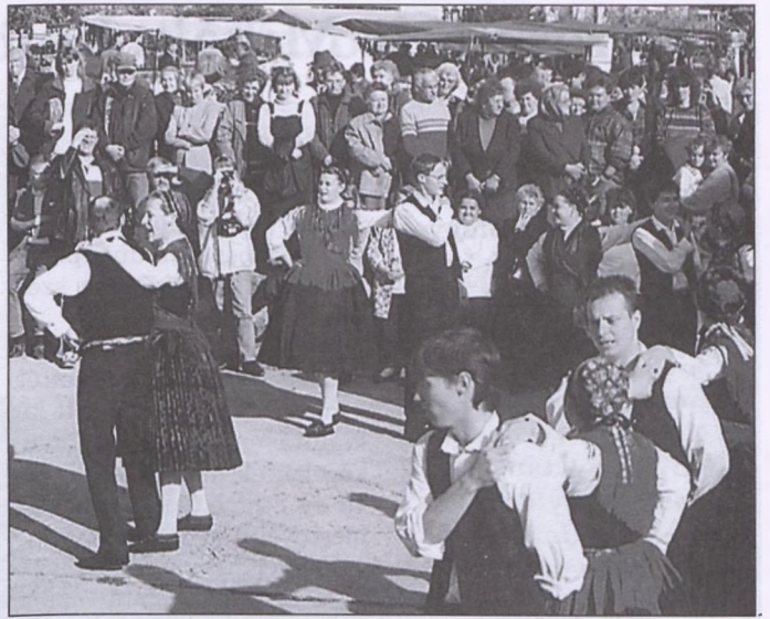
A környék német táncai. Véméndiek