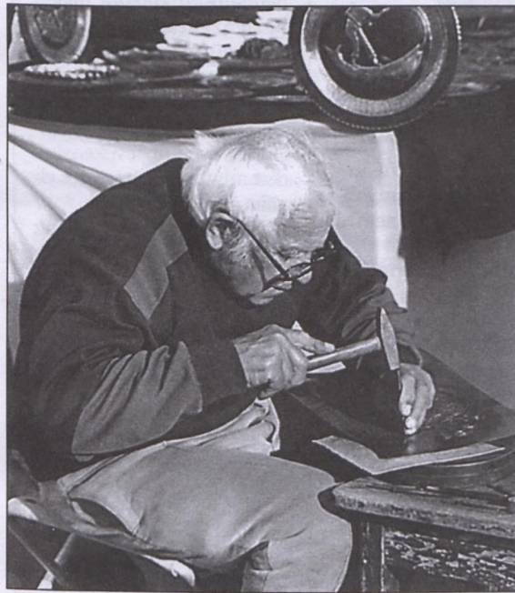
Az ötven kézműves egyike