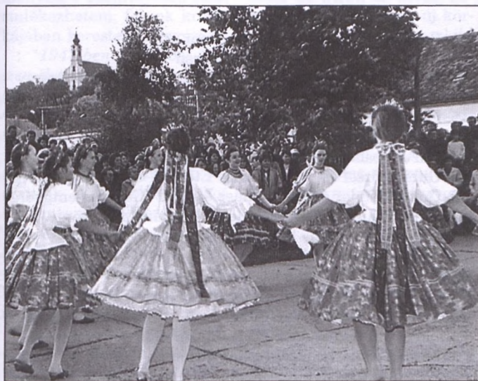
„Megérett a fekete gesztenye.!”