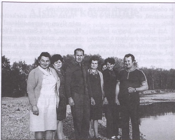
Hazalátogatás, találkozások. A Gubik-család tagjai a Garam partján 1970 körül

Az érintett családok tagjai a kitelepítés dokumentumai között