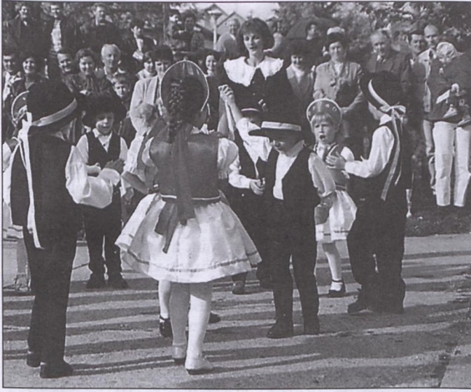
A legkisebbek tánca