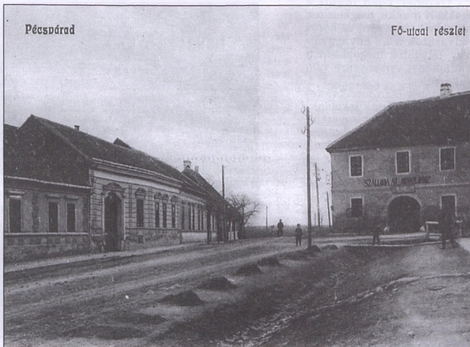
A könyvtárépület, az egykori Arany Ló Szálló a század első éveiben