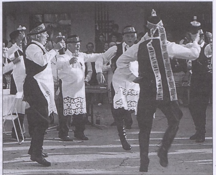
A Döbröközi Férfikar