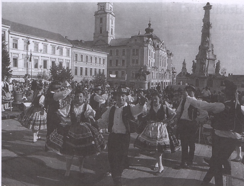
A szőlő és bor ünnepén, a Pécsi Napokon lépett fel a Zengővárkonyi Népiegyüttes.