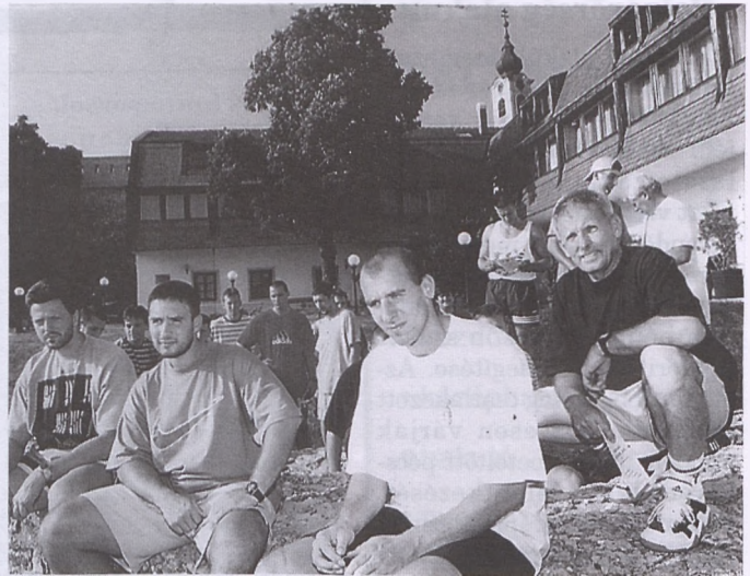
Képünkön a magyar kézilabda-válogatott Pécsváradon.