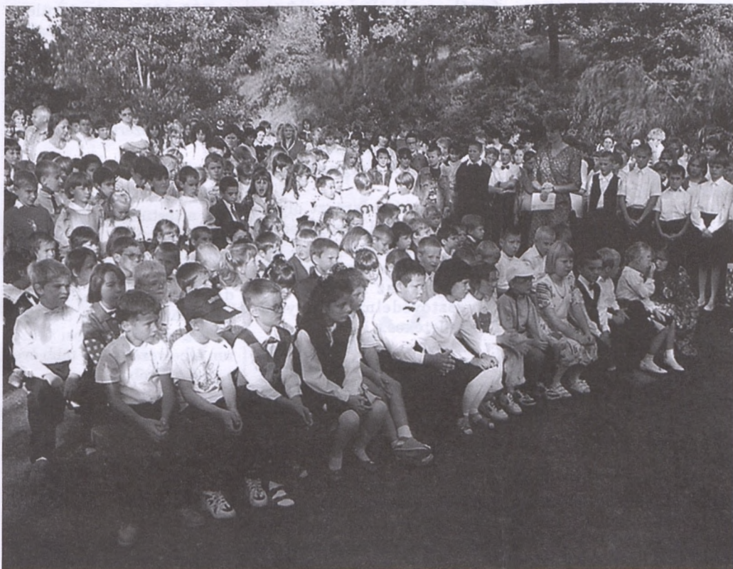
Előseink a tanévnyitón.

Az önkormányzat lapja • 1997. október • VII. évf. 10. szám • Ára: 50,-Ft