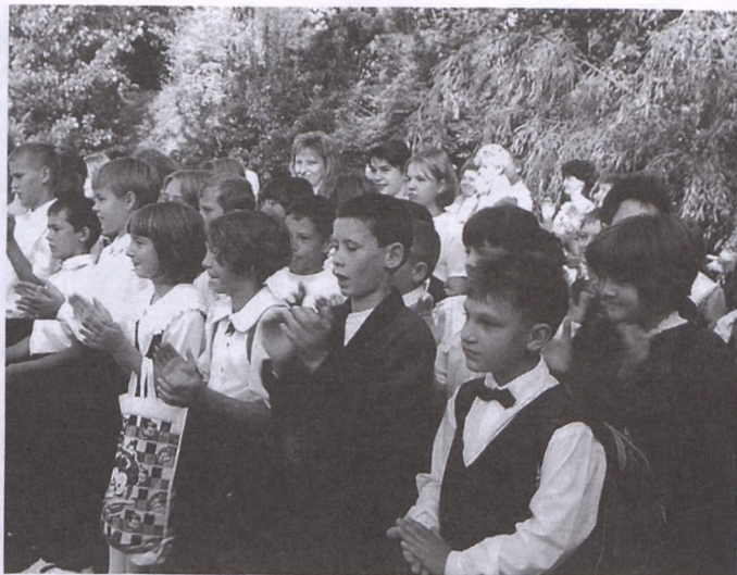
Ötödikesek szeptember 1-jén a tanévnyitón

Köszönet illeti a becsületes megtalálókat!