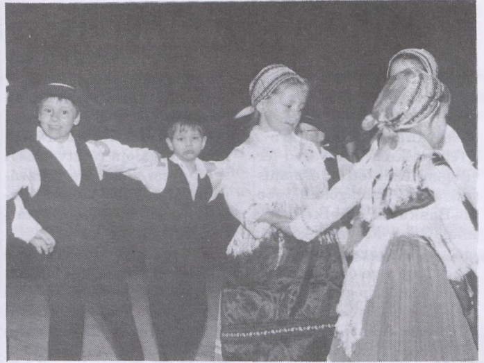
A pécsváradói óvodások is részt vettek április 12-én Harkányban a baranyai gyermek-néptáncosok 5. találkozásán.

Az orosz helyett 1990-ben kezdték a németoktatást Sziléziában, felső tagozaton, két éve pedig az egész iskolában. Ahol 7 szülő kéri, ott német az első idegen nyelv. Sokat változott a helyzet 1990 óta: kapcsolatok létesültek Németországgal, új egyesületek, művészeti csoportok születtek a lengyelországi németek körében.