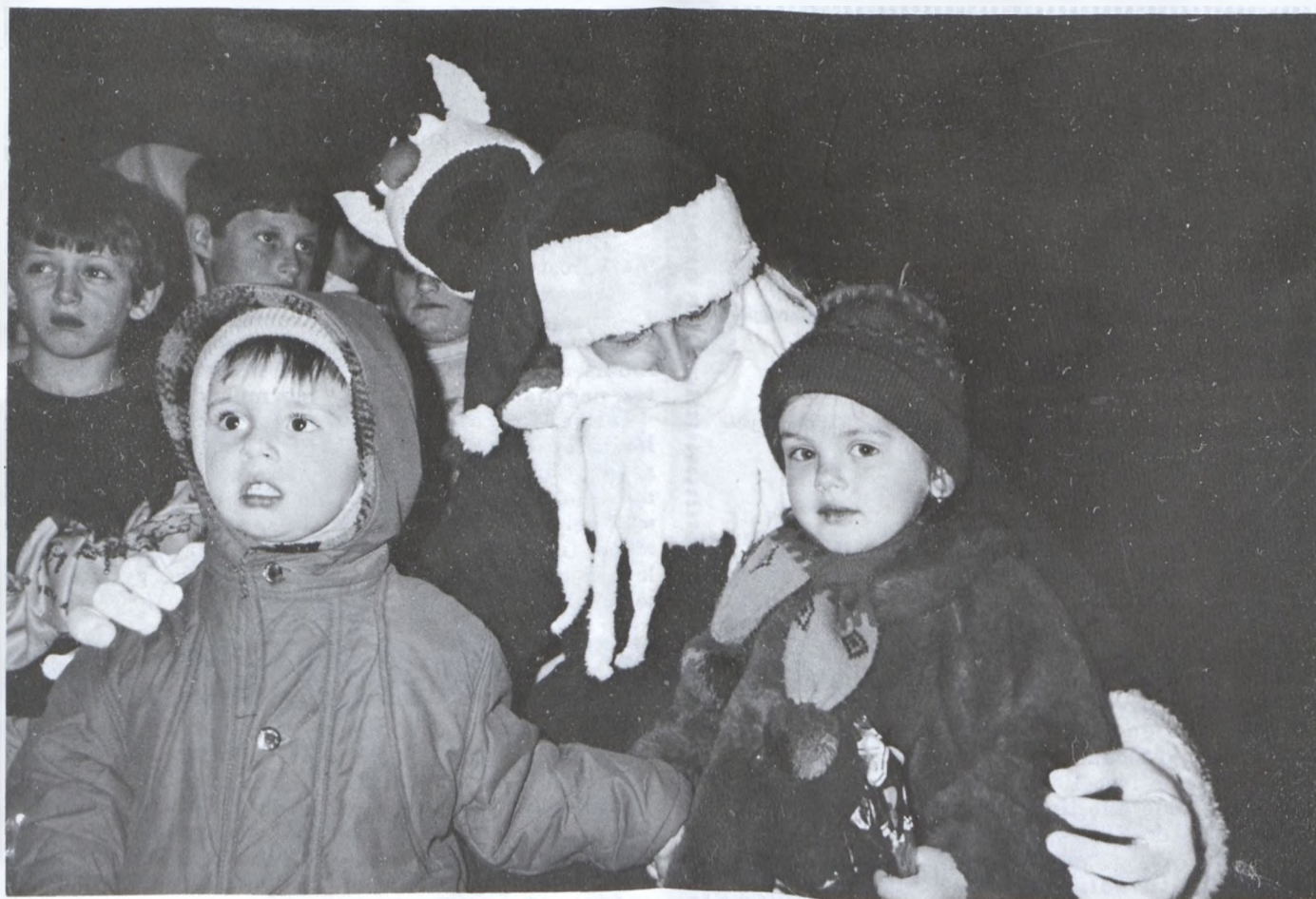
Pécsváradra is ellátogatott decemberben a Mikulás