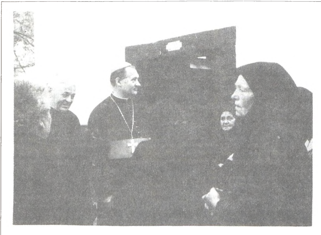
Mayer püspök úr és Mott apátúr a hívek között