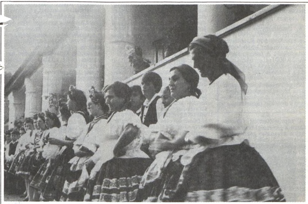
Képünkön a Zengővárkonyi Néplegyüttes

Szüreti felvonulás, népművészeti kirakodóvásár, murcikkóstolás és gesztenyeszüret lesz október 12-13-án Pécsváradon és Zengővárkonyban.